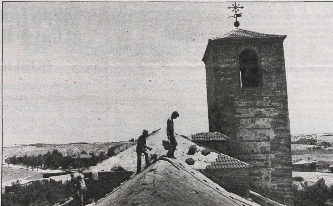
Sobre las obras que se están realizando en el tejado, todavía no se ha pronunciado casi nadie. El párroco, que en principio se oponía, al final se ha dejado llevar por la tónica general

Una de las soluciones barajadas, pero que fue rechazada por el arzobispado, igual que todas las que se presentaron, fue aportada por el arquitecto Fernando Chueca, quien estimó que lo mejor era colocar urulita plana y encima la teja árabe, con lo que se solucionaba el problema de las goteras.