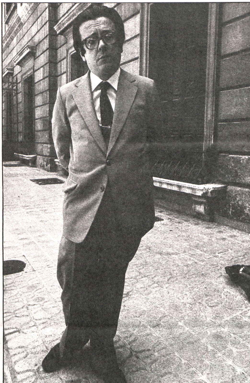
Portavoz del grupo parlamentario de UCD en el Congreso de los Diputados. Entre liberal y democristiano. Enfrentado políticamente al aparato del partido centrista. Ahora es uno de los principales promotores de la corriente Plataforma Moderada, la que otros llaman conservadora, que recoge el espíritu del sector crítico surgido en los meses anteriores al II Congreso de UCD, que se celebró a primeros de febrero en Palma de Mallorca

La ironía de Miguel Herrero, cuando se convierte en causticidad, puede ser arrasadora. Los del aparato van a tratar de desmontarle de la presidencia del grupo parlamentario en el otoño. Imagínense cómo se va a defender Miguel Herrero.