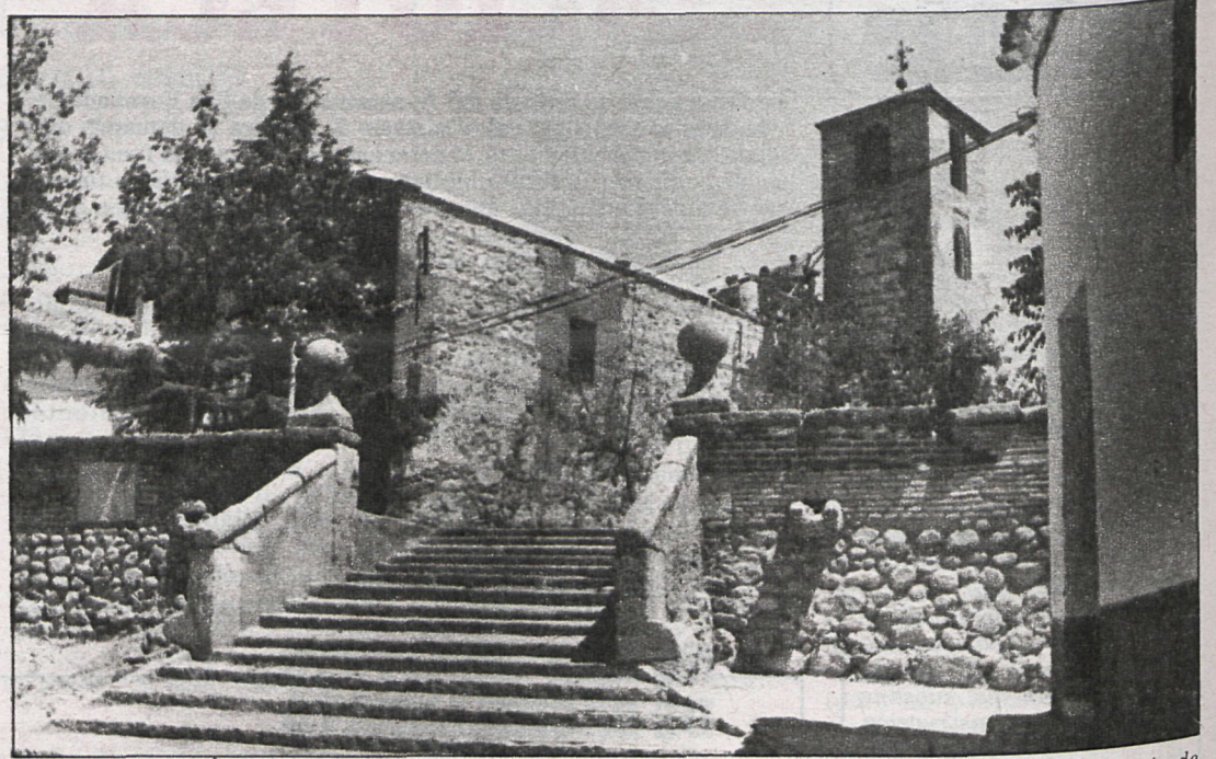
Terminada de construir a finales del siglo XVII, la iglesia de Villamanta ha sufrido toda una serie de despropósitos durante nuestro siglo. Desde la venta del órgano al peso hasta la eliminación de los altares primitivos