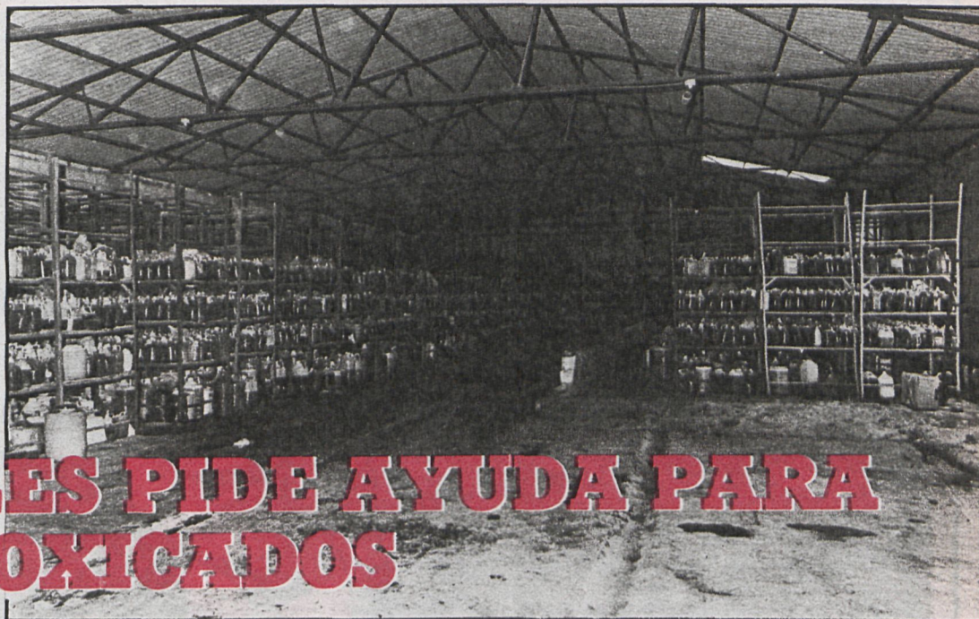
Aceite tóxico: está causando estragos físicos y económicos. El Ayuntamiento de Mostoles quiere que los envenenados reciban las ayudas necesarias

El pleno del Ayuntamiento de Mostoles, celebrado el pasado 29 de agosto, aprobó por unanimidad una moción presentada por el grupo socialista en la que se insta al Gobierno a que en un plazo de veintidós días envíe al Congreso de los Diputados un proyecto de ley, a tramitarse por el procedimiento de urgencia, concediendo diversas ayudas a los damnificados por el envenenamiento de aceite tóxico