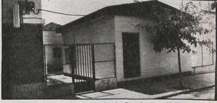
Central telefónica de Villanueva de la Cañada: sus 400 líneas están saturadas

El día 23 de julio de 1980 se inauguraba la central automática de teléfonos de Villanueva de la Cañada, que da servicio asimismo a Brunete y Quijorna. En menos de un año han quedado totalmente saturadas todas sus líneas. La Compañía Telefónica dice que no puede hacer ninguna ampliación hasta 1983. Mientras tanto, las numerosas personas que han solicitado la instalación de teléfono han de conformarse con hablar desde las cabinas públicas, cuando funcionan