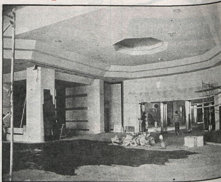
Durante la visita de CISNEROS al casino, se estaban dando los últimos «toques» a las instalaciones, con el fin de que todo estuviera a punto para el día de la inauguración

Los puestos de trabajo que se han originado para la construcción han sido cubiertos por obreros de Torrelodones y de los pueblos de los alrededores. La plantilla del casino Gran Madrid constará de 520 puestos de trabajo, que estarán divididos en: servicios generales, 120; restauración, 80; emplea-