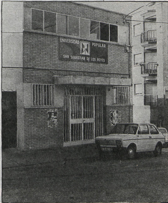
Este será el edificio que servirá de nueva sede a la Universidad Popular

El traslado a la actual sede, en la plaza de la Iglesia, junto con la disponibilidad absoluta de los barracones del colegio que utilizaban sólo por las tardes, hizo que las condiciones mejoraran sensiblemente. A esto se añadió una primera dotación de material para algunos cursos, como fotografía y taquimecanografía. Para este curso, los locales con los que cuenta la Universidad Popular son los mismos, pero en el edificio de la plaza de la Iglesia se han he-