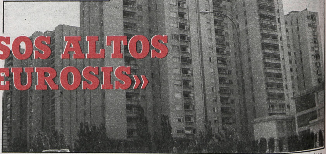
Durante los últimos meses, los ciudadanos contemplan la construcción de los edificios habitados más altos de Madrid

«El objetivo del Instituto es precisamente llevar a cabo un tratamiento preventivo de la salud mental, evitando las causas que producen desequilibrios»