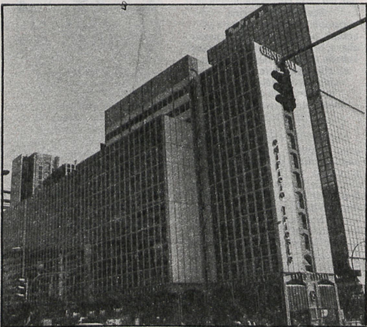
La tensión que los ciudadanos acumulan en los pisos altos se manifiesta posteriormente en sus relaciones cotidianas