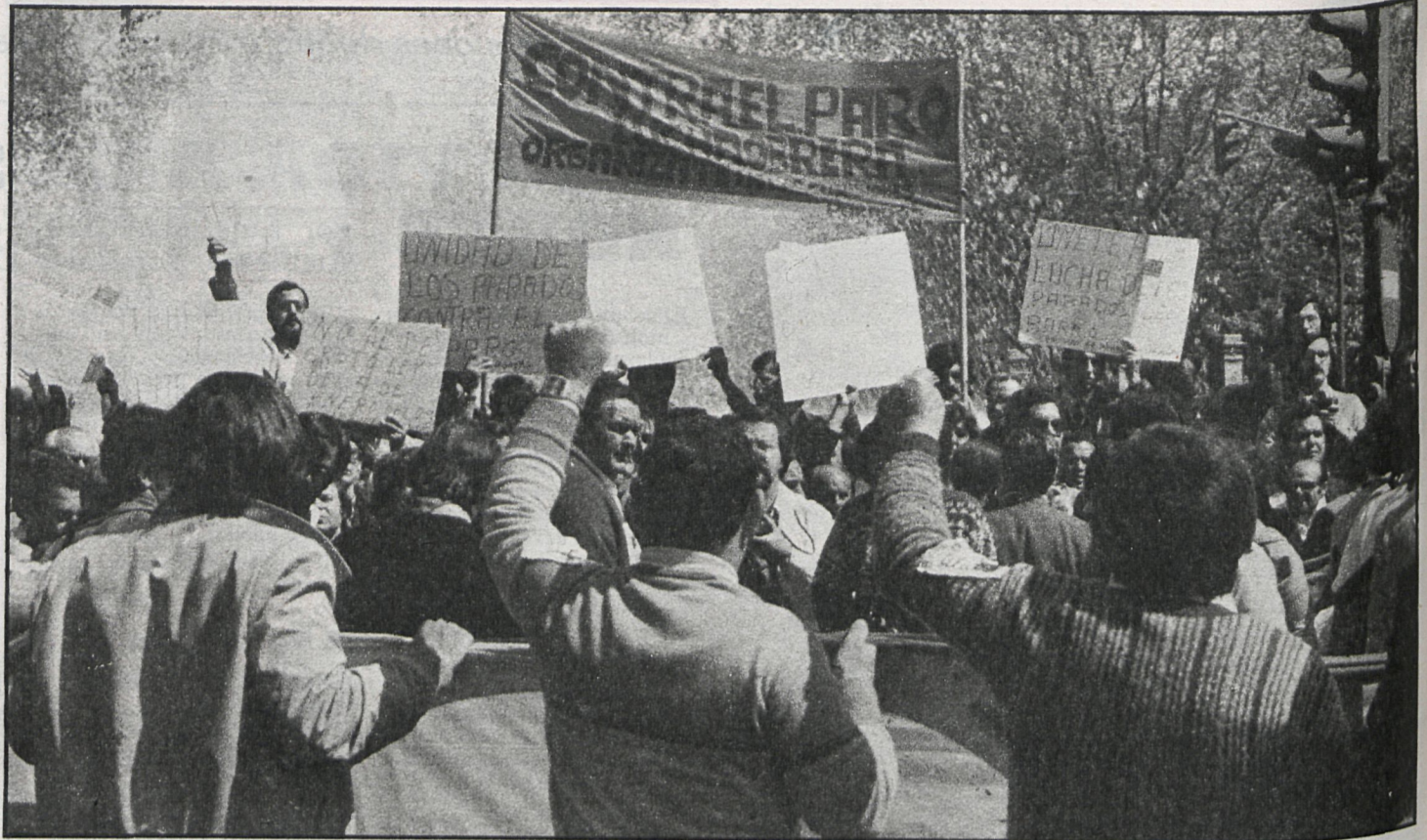
El boicot al acuerdo sobre empleo puede aumentar el índice de paro y generar tensiones, ya casi olvidadas, a nivel de calle

A estas alturas del curso, la patronal quiere cargarse, lisa y llanamente, el Acuerdo Nacional del Empleo, que ha venido a ser el pacto social en este país. En ningún país del mundo los empresarios han intentado boicotear un acuerdo de este tipo, que resulta ser la única salida seria, responsable y coherente a un momento de crisis total.