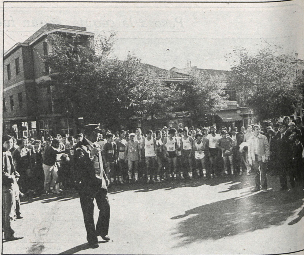
Los corredores, en la línea de salida