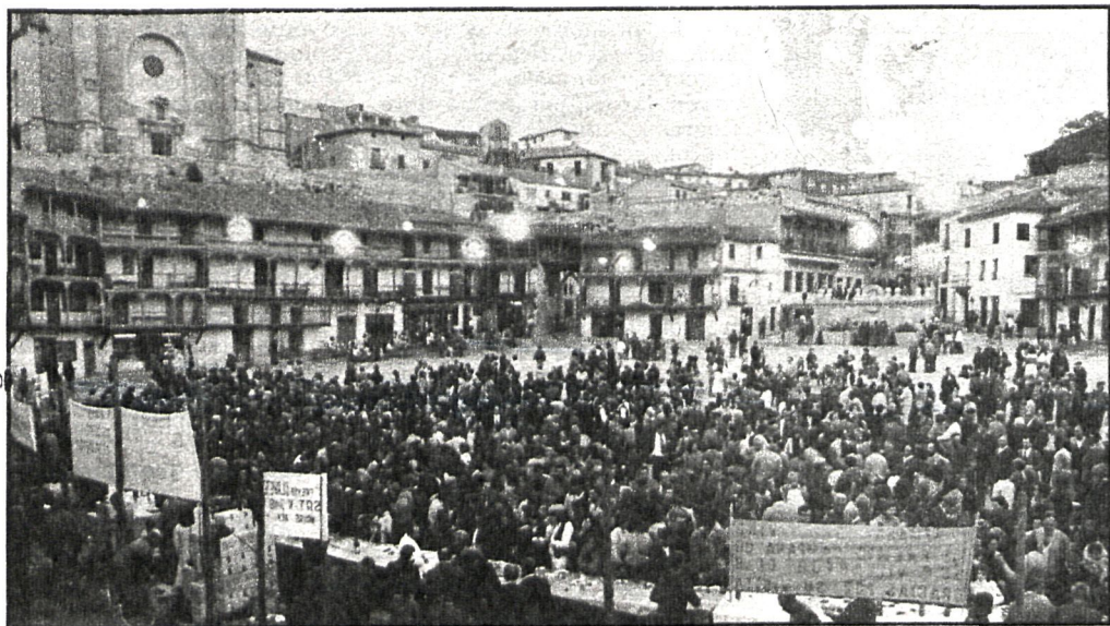
Carta popular de caldos madrileños en la plaza de Chinchón