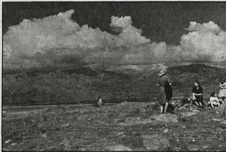
La corporación de Colmenar no quiere que se degrade el entorno y riqueza ecológica del municipio

Estas no son zonas donde estén actuando los cooperativistas. Por el contrario, es una zona (la del plan parcial 2-E) en donde, según la memoria de los proyectos de Tres Cantos, estaba previsto hacer viviendas para habitantes de niveles de renta altos o muy altos y la