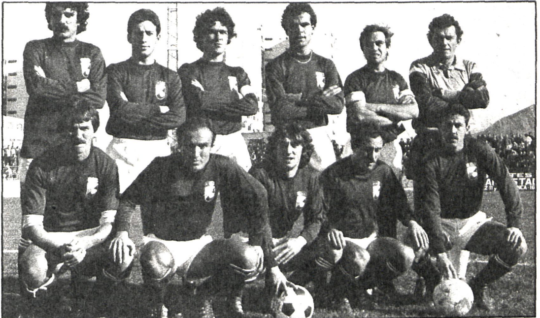
Los jugadores del Alcalá lucharán a fondo para mantener y, si es posible, mejorar su clasificación

Destacamos esta semana la confrontación Alcalá-Ensidesa, en el que el equipo de la comarca del Henares tiene posibilidades de anotarse dos nuevos puntos. De producirse esta nueva victoria —la pasada semana venció a la Leonesa por cuatro goles—, el conjunto alcaláino puede desbancar a los equipos que actualmente van por delante en la cúspide de la clasificación.