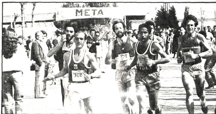
La temperatura, muy veraniega, dificultó la «labor» de los corredores

Organizado por el Club Atlético Torrejón, por delegación de la FAM, se disputó el pasado día 7 el primer campeonato de Castilla de gran fondo en carretera y la cuarta jornada del campeonato de Madrid de gran fondo en carretera.