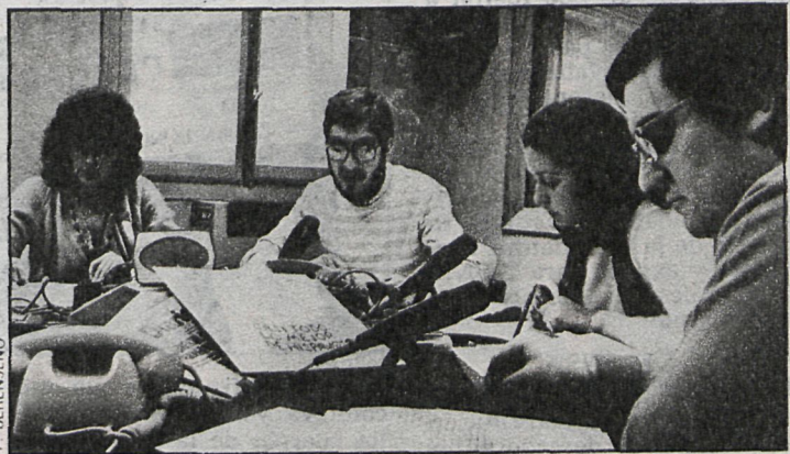
Parte del actual equipo de Radiocadena durante la emisión de uno de los programas