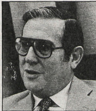
ALFONSO OSORIO Diputado de Coalición Democrática

dactar el estatuto de autonomía para Madrid, sobre todo en los temas electorales como ya es tradicional en la elaboración de los estatutos. Pero creo que en España ya hay suficiente experiencia en este terreno, lo que ha de facilitarnos la tarea» (18 de septiembre de 1981).