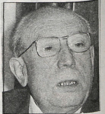
ENRIQUE TIERNO GALVAN Alcalde de Madrid.

Pensar que en Madrid pueda existir un gobierno autónomo me parece sencillamente ridículo» (25 de septiembre de 1981).