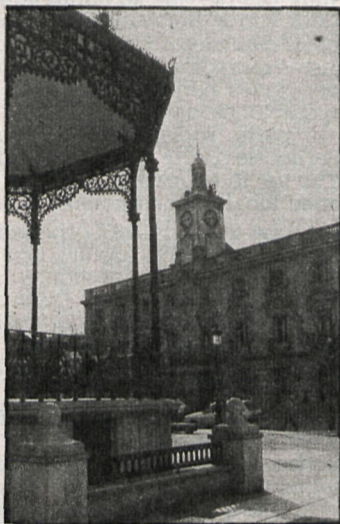
El Ayuntamiento de Alcalá no tiene actualmente deudas pendientes con el Estado, por lo que se refiere a los impuestos.

ción central. Todas las transferencias están pasadas hasta este momento.