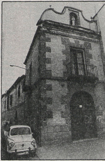
Aspecto exterior del hospitalillo, que pronto albergará el centro gerontológico, dotado de servicios médicos, de rehabilitación, asistencia social y gimnasio