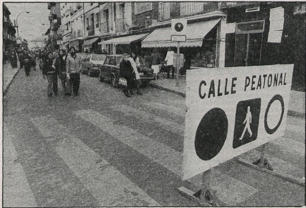
Actualmente se está procediendo en Getafe a la peatonalización de diversas calles, materializando así la filosofía del plan general de «enlazar» la ciudad mediante zonas privadas de circulación de vehículos

■ Para el día 18 de marzo está prevista en la Casa de la Cultura de Leganés la proyección de una selección de cortometrajes de Segundo de Chumón y Luis Buñuel.