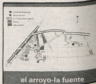
el arroyo-la fuente

Estos son algunos de los folletos editados por el Ayuntamiento para dar a conocer el Plan General.