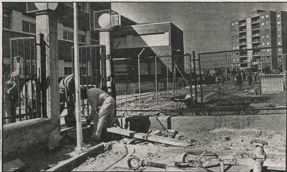
Actualmente, en Fuenlabrada hay 28.000 viviendas vacías, en construcción o con licencias de obras ya concedidas

La repartición de los puestos se ordenará de la siguiente forma: 25 por 100 se reservarán a productos de alimentación, 65 por 100 a artículos varios, 10 por 100 a artículos de libre disposición y otro 10 por 100 a productos directos, generalmente pensados para los agricultores de Leganés. El 20 por 100 se reserva a puestos para vecinos de Leganés