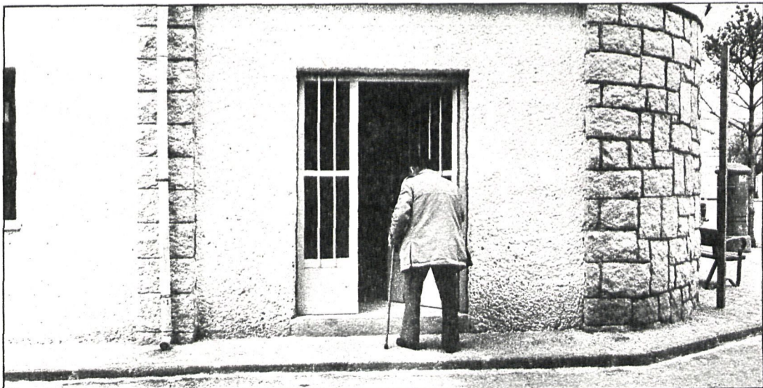
El club —que vemos en la fotografía— cuenta ya con 115 socios de un total de 130 ancianos residentes en el pueblo

Para este servicio se tiene previsto un equipo de tres vehículos con su respectiva dotación.