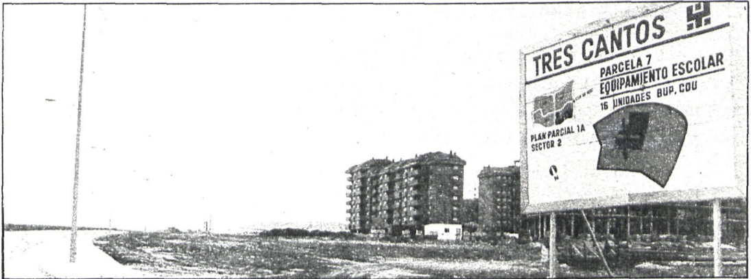
Cartel anunciador de uno de los equipamientos que se proyectaron —el escolar—, cuyas obras aún no se han iniciado

En el mismo estado se encuentran las dotaciones religiosas, cuya fecha de