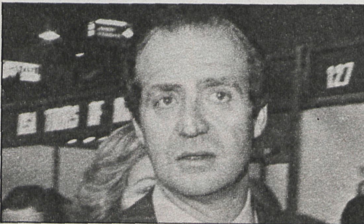
Don Juan Carlos I