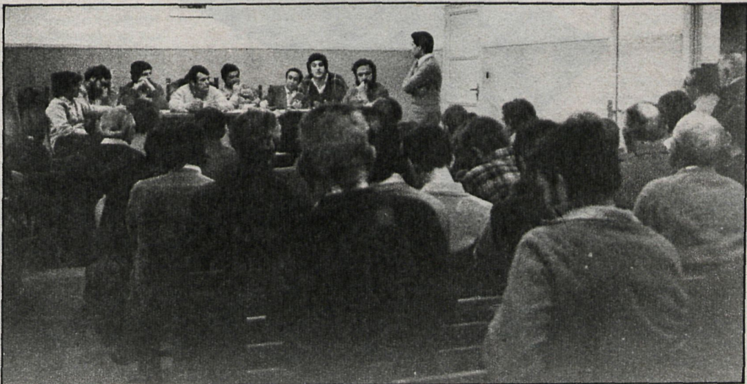
Sala de plenos del Ayuntamiento de Rascafría, donde numerosos vecinos acudieron para preguntar a los técnicos diversos aspectos del nuevo planeamiento del municipio

Un acto de similares características se realizó en Alameda del Valle el jueves 22 de abril, con asistencia del alcalde, técnicos del Servicio de Urbanismo de la Diputación y miembros del equipo redactor de las normas subsidiarias de planeamiento.