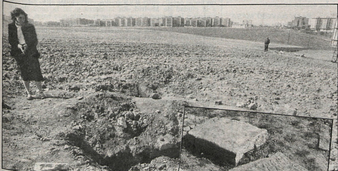
Descubiertos varios restos de la época medieval