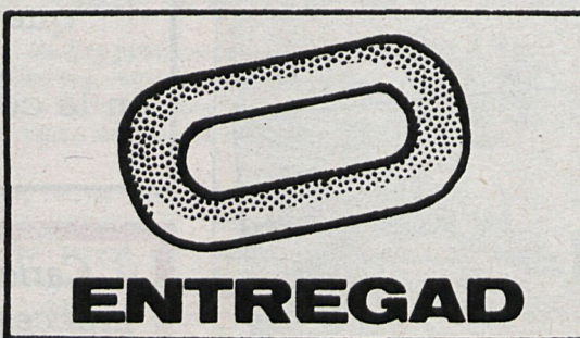
¿Cuál es su mejor cualidad?