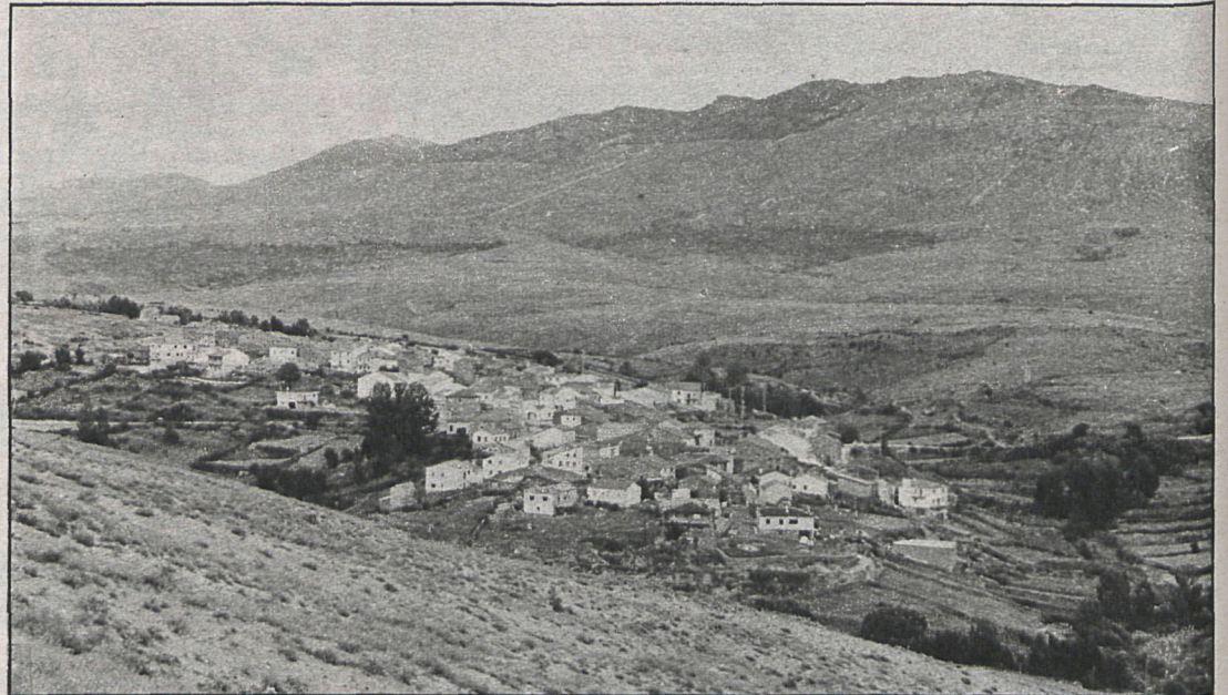
Lozoyuela, por fin, puede ver sin interferencias la televisión, pese a las altas montañas que rodean el pueblo

Aunque al principio los televidentes se mostraron reacios a pagar las 3.000 pesetas de la puesta en marcha de los aparatos, hoy los vecinos de Lozoyuela están contentos al ver resuelto el problema que durante varios años han venido padeciendo por la lentitud