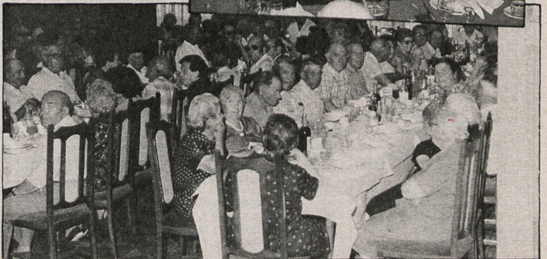
Aspecto que ofrecía el salón en el que los ancianos de El Alamo recibieron el homenaje del pueblo