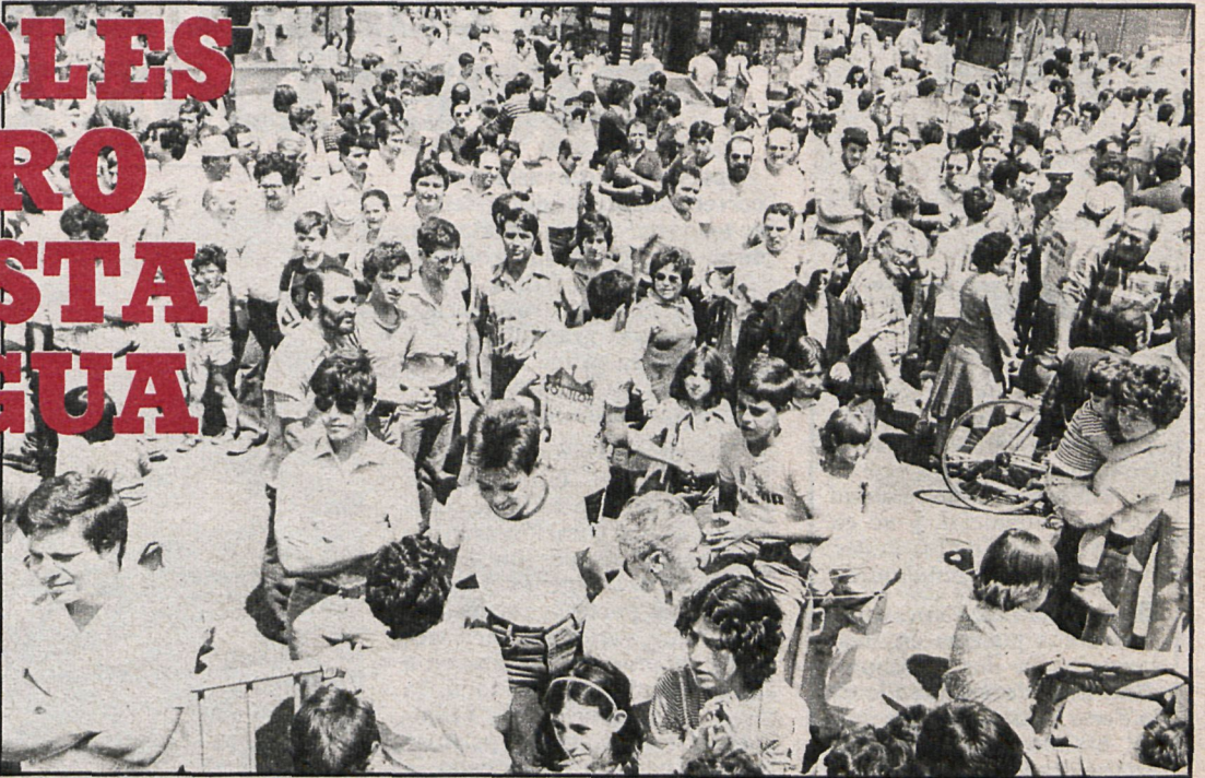
El pueblo de Mostoles participó masivamente en los actos de la Fiesta del Agua y se convirtió en el verdadero protagonista de esta celebración

En un ambiente distendido y con una masiva participación del público en los diversos actos programados por el Ayuntamiento, Mostoles festejó el pasado sábado, día 26 de junio, el segundo aniversario de la llegada del agua del Canal de Isabel II, hecho que hizo cambiar radicalmente la forma de vivir de esta ciudad y que se ha convertido en un símbolo para que sus moradores, en su gran mayoría llegados en los últimos diez años, echen raíces definitivamente