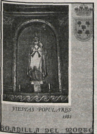
BOADILLA DEL MONTE

■ También en Boadilla del Monte se han celebrado las fiestas patronales, del 24 al 27 de junio, con un extenso programa que incluía actuaciones musicales.