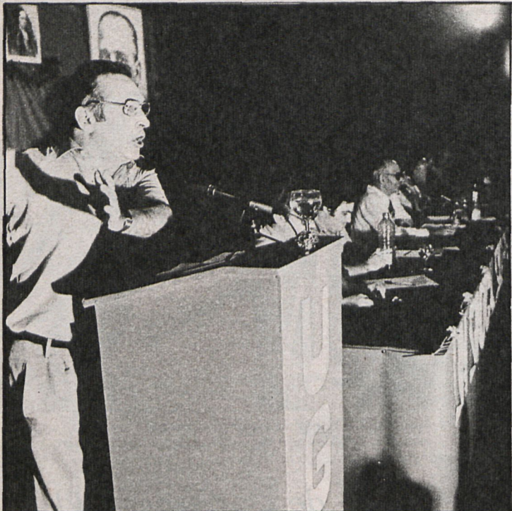
La ejecutiva de la UGT, con Nicolás Redondo a la cabeza, considera que la situación sobre el control de la inflación no puede ser más negativa