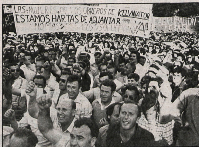
El conflicto de Kelvinator, en Getafe, ha sido uno de los que más repercusión ha tenido en el presente año. En el mes de mayo todo el pueblo paró en solidaridad con los trabajadores de esta empresa, amenazados de despido

Esta exigencia —dice la Comisión Ejecutiva de UGT— está justificada en el compromiso adquirido por el Gobierno de controlar la inflación en el nivel previsto del 12-12,5 por 100, y la no revisión salarial para estos colectivos importaría un incumplimiento del ANE por parte del Gobierno.