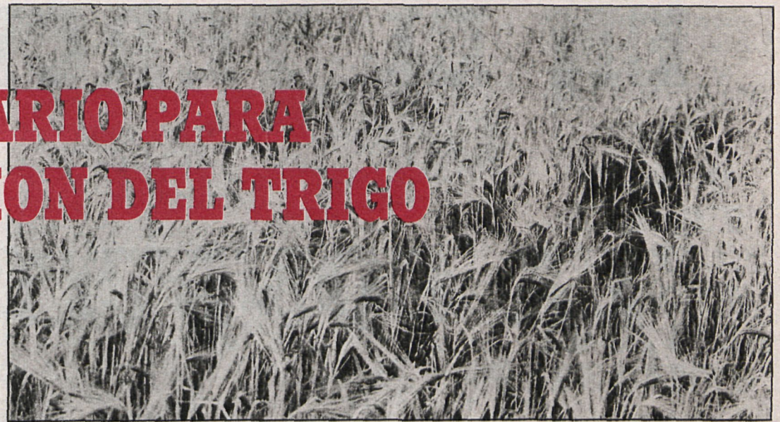
Después de muchas promesas incumplidas, parece ser que ahora ya va en serio la liberalización del mercado del trigo

Ante estos problemas, en esta regulación de campaña se ha tratado especialmente este problema, habiéndose autorizado al FORPPA para el establecimiento de convenios de colaboración con las empresas desde el inicio de la campaña. Esta es, sin duda, la nota más destacada e importante de la presente regulación de gran interés para los ganaderos de vacuno y porcino.