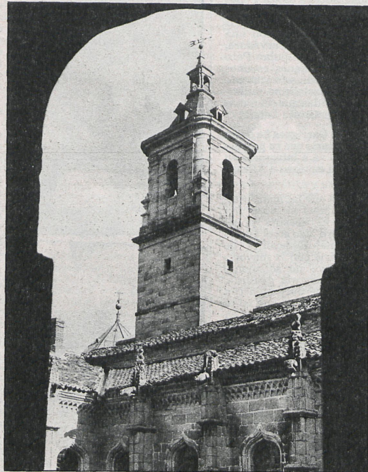
Torre del monasterio de El Paular, en Rascafría, vista desde el claustro

Pero hagamos una breve síntesis de cuanto representa el Patrimonio Nacional y las fundaciones de los reales patronatos, que administra aquí y que provienen de la historia remota de España. Fuera de la provincia madrileña, sus bienes son palacios y terrenos anexos de La Granja, donde el 95 por 100 del término municipal es propiedad del Patrimonio Nacional, y Riofrio, en Segovia; el palacio de la Almudaina y sus jardines, de Palma de Mallorca; monasterio de Las Huelgas, en Burgos, y el hospital del Rey; el convento de Santa Clara, en Tordesillas; el colegio de Doncellas Nobles, de Toledo, como antes lo fueron los Reales Alcázares, de