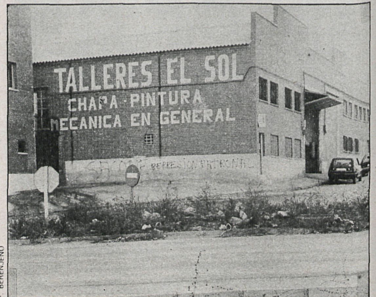
Cada sector industrial tiene unas características que exigen la utilización de cuestionarios distintos