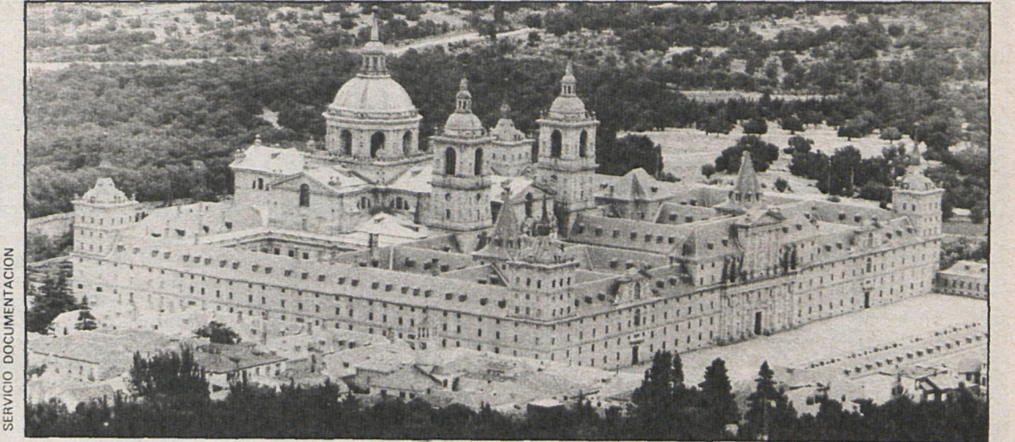
Los principales ingresos del monasterio de El Escorial provienen de los cientos de miles de turistas que lo visitan cada año

supultura Isabel de Valois, tercera esposa de Felipe II, hasta que fue trasladada a El Escorial cuando se terminó el monasterio. Santa Teresa de Jesús pasó algunos días mientras preparaba la fundación de conventos. Conserva cuadros de los primitivos pintores flamencos, tapices, pinturas de grandes artistas, orfebrería, esculturas, objetos artísticos de gran valor, frescos, escaleras, salones, claustros bellísimos, antecoros, capillas, tablas, retablos, todo ello dentro del capitulo del arte y de la historia.