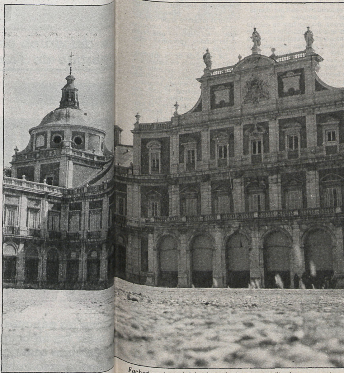
Fachada principal del palacio de Aranjuez, utilizado como residencia para jefes de Estado extranjeros en visita oficial a España