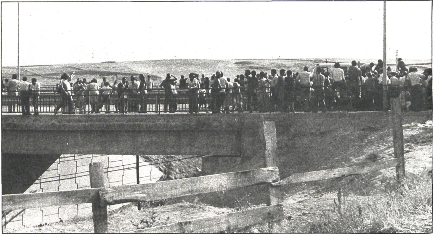
El puente de Coslada es una de las realizaciones llevadas a cabo por el Ayuntamiento, de cuya gestión se sienten satisfechos los vecinos.

Según los resultados de una encuesta realizada por encargo del Ayuntamiento