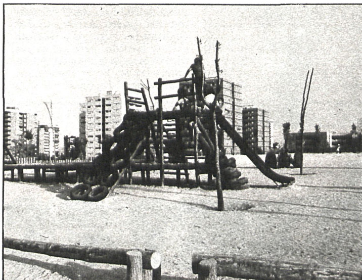
Las zonas recreativas son uno de los aspectos que más echan en falta los vecinos de Coslada.

Madrid-capital es el lugar donde prefiere vivir el 31 por 100 de los entrevistados; el 11 por 100, en otros barrios dentro de Coslada, y el otro 17 por 100, en otras poblaciones del Área Metropolitana.