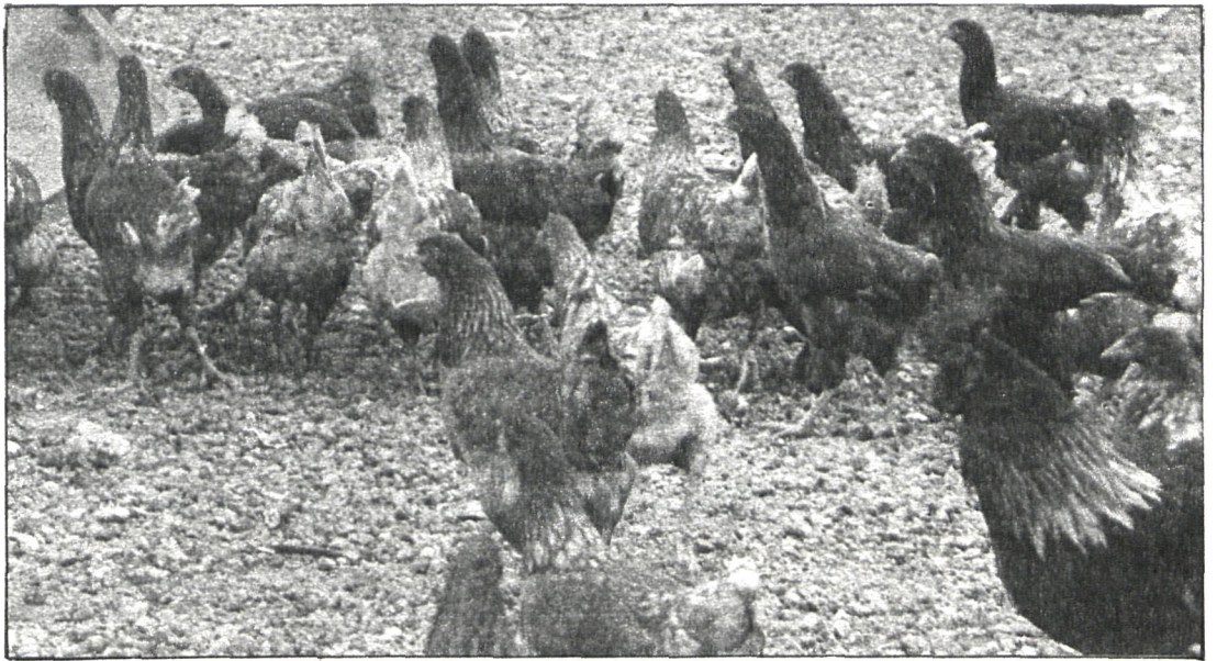
A pesar de llevar un mes sin comer ni beber, 12.000 gallinas se han salvado de una muerte segura por la intervención de los servicios veterinarios del Ayuntamiento, alertados por los vecinos