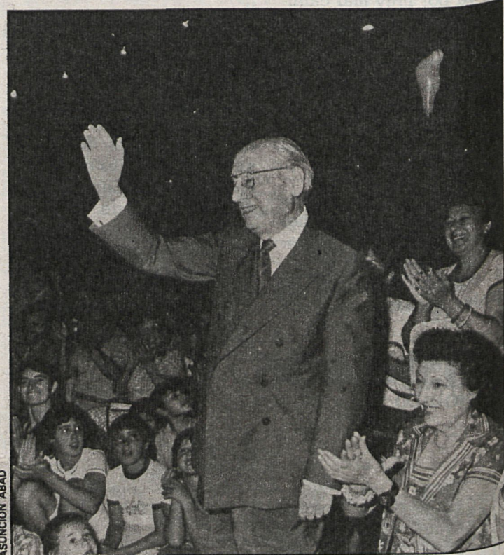
El alcalde de Madrid, Enrique Tierno Galván, también estuvo presente en Las Vistillas el día 11 presenciando la elección de la Casta, la Susana y el Don Hilarión de 1982