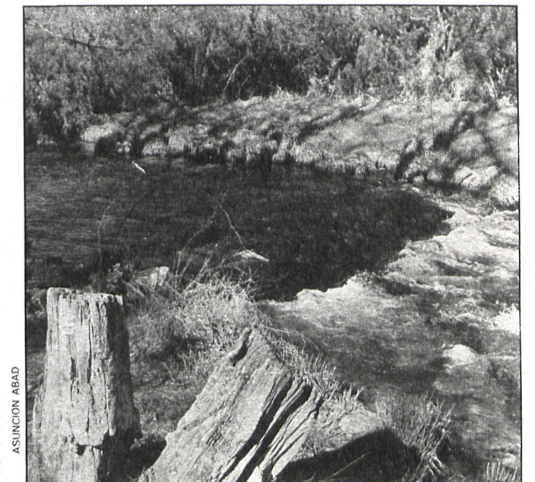
En su recorrido por la sierra, los ríos madrileños llevan el agua pura y cristalina.

El Jarama y su cuenca abastecen a la capital; el Guadarrama, a los veraneantes de la sierra, y el Manzanares nunca consiguió ser navegable En la actualidad casi todos sufren un grave deterioro por la contaminación de los vertidos de aguas residuales, tanto de las industrias como de las concentraciones humanas que en los últimos años han proliferado a lo largo y ancho de nuestra región