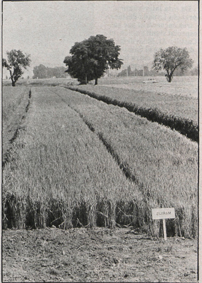
Las cosechas este año se han visto sensiblemente mermadas por culpa de la sequía

Aunque los pantanos están al 38 por 100 de su capacidad