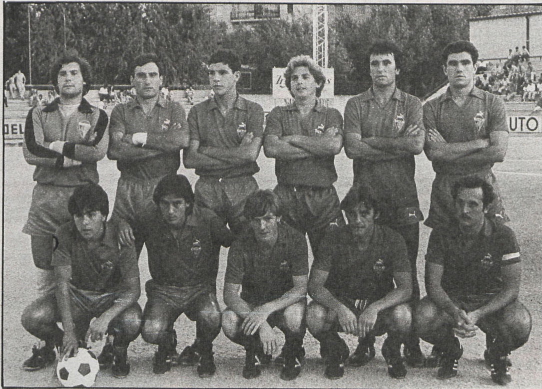
Los chicos del Aranjuez se esforzarán por mantener el liderato

ALBACETE-ALCALA. — Después del descalabro de la pasada jornada, los alcalalinos se aprestan a afrontar el des-