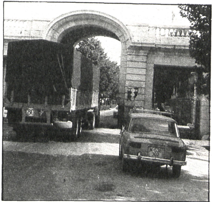
El Ayuntamiento ha reivindicado durante años la construcción de la variante

Las obras que se realizarán suponen una inversión de dos mil millones de pesetas y pueden estar terminadas en 1984