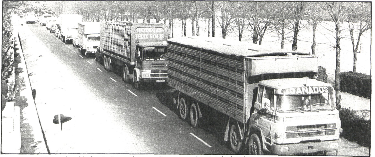
El paso de vehículos, tanto pesados como ligeros, por el centro de Aranjuez ocasiona grandes atascos

Ha comenzado la redacción del proyecto que «sacará» la carretera de Andalucía del casco urbano