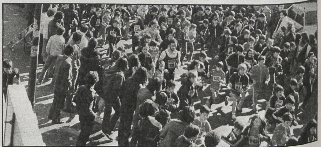
El Ayuntamiento ha hecho un gran esfuerzo por llevar el deporte a los vecinos de Fuenlabrada. En la foto, una de las competiciones populares, que se compagina con pruebas para deportistas «profesionales»