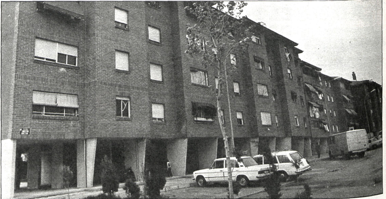
El barrio de las Fronteras es, por el momento, el único afectado por el brote de hepatitis

Aunque el brote de hepatitis del barrio de Las Fronteras está controlado, según Sanidad