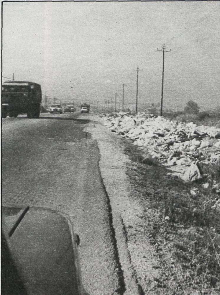
La recogida de basuras del municipio ha sido la piedra de toque para la polémica

Días atrás tuvo lugar una reunión entre el delegado de Cultura y Deportes del Ayuntamiento de Móstoles con el director de Servicios Culturales y la representación de las