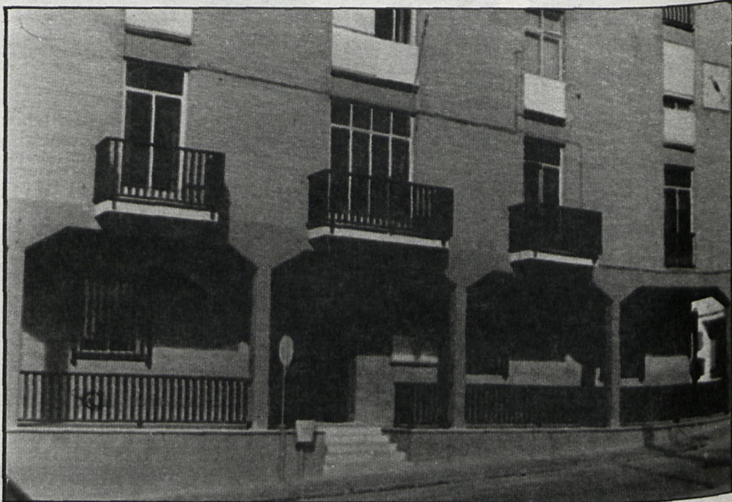
En el Ayuntamiento de Algete, las irregularidades en la gestión por parte del alcalde han sido constantes en los últimos años