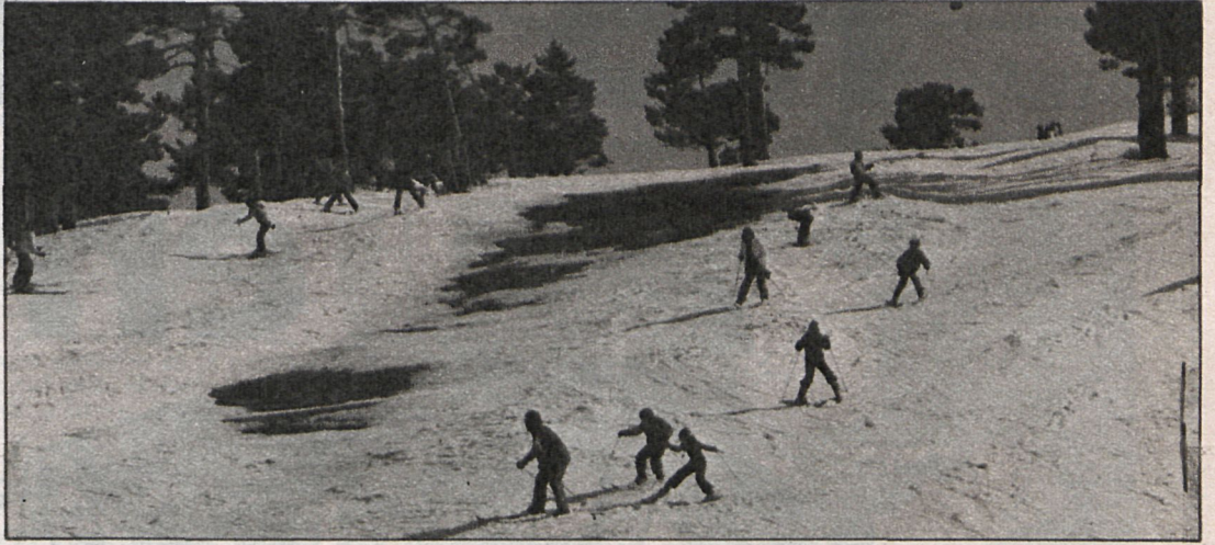
Actualmente, el esquí es uno de los deportes que más se practican en Navacerrada, sobre todo a raíz de las campañas de promoción

Hay que decir que en Navacerrada no existen escuelas deportivas, únicamente funciona el deporte a nivel escolar. «Efectivamente, es entre semana cuando más se practica el deporte a nivel escolar, los fines de semana se realizan competiciones.» A partir del día 27 de este mes comienza la Liga