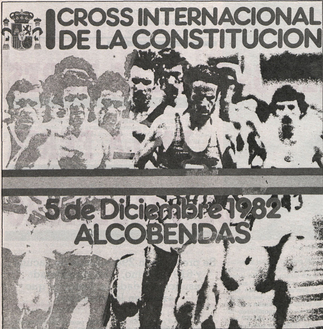
Se celebrará por primera vez el día 5 de diciembre en Alcobendas