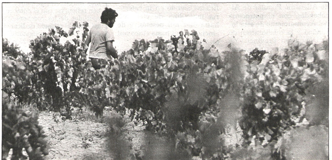
Las ayudas aprobadas han sido 767, rechazándose 399 solicitudes

de la Mesa de la Sequía fueron 767, con ayudas de 100.500.000 pesetas. Las hectáreas afectadas, según los criterios empleados, han sido 26.000, de las 38.000 hectáreas que sumaban las solicitudes presentadas. Por tanto, se rechazaron 12.000 hectáreas correspondientes a 399 solicitudes. A concretar estas ayudas se llegó, reduciendo las cantidades asignadas en un principio por falta de presupuesto, además de rechazar 399 solicitudes con daños inferiores a los requeridos, según los baremos.