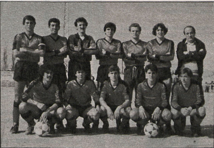
Plantilla actual del Atlético de Pinto

Leganés y Getafe se enfrentan esta semana en un partido de tradicional rivalidad local