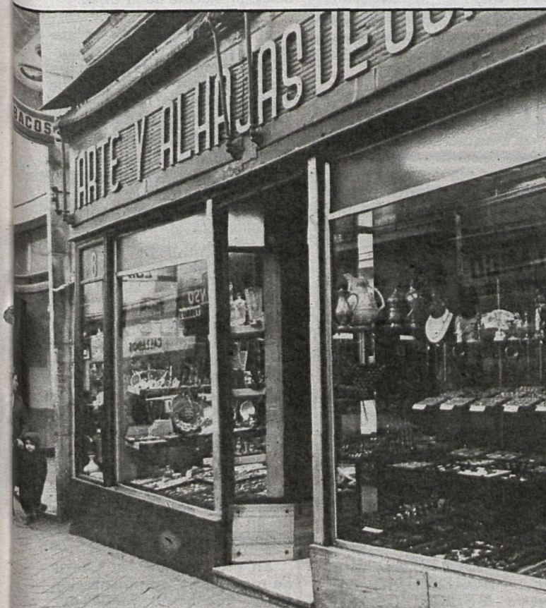
El comercio constituye una de las principales actividades económicas en Madrid