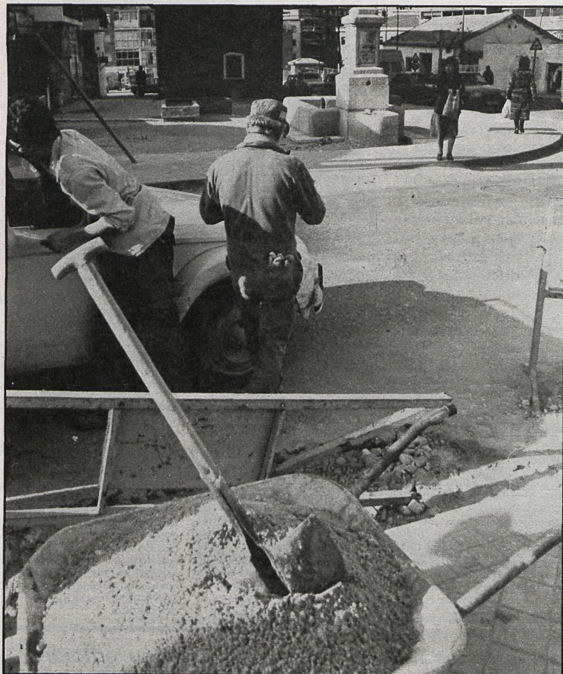
El sector secundario, en el que se incluye la construcción, absorbe el 28 por 100 de la renta bruta anual