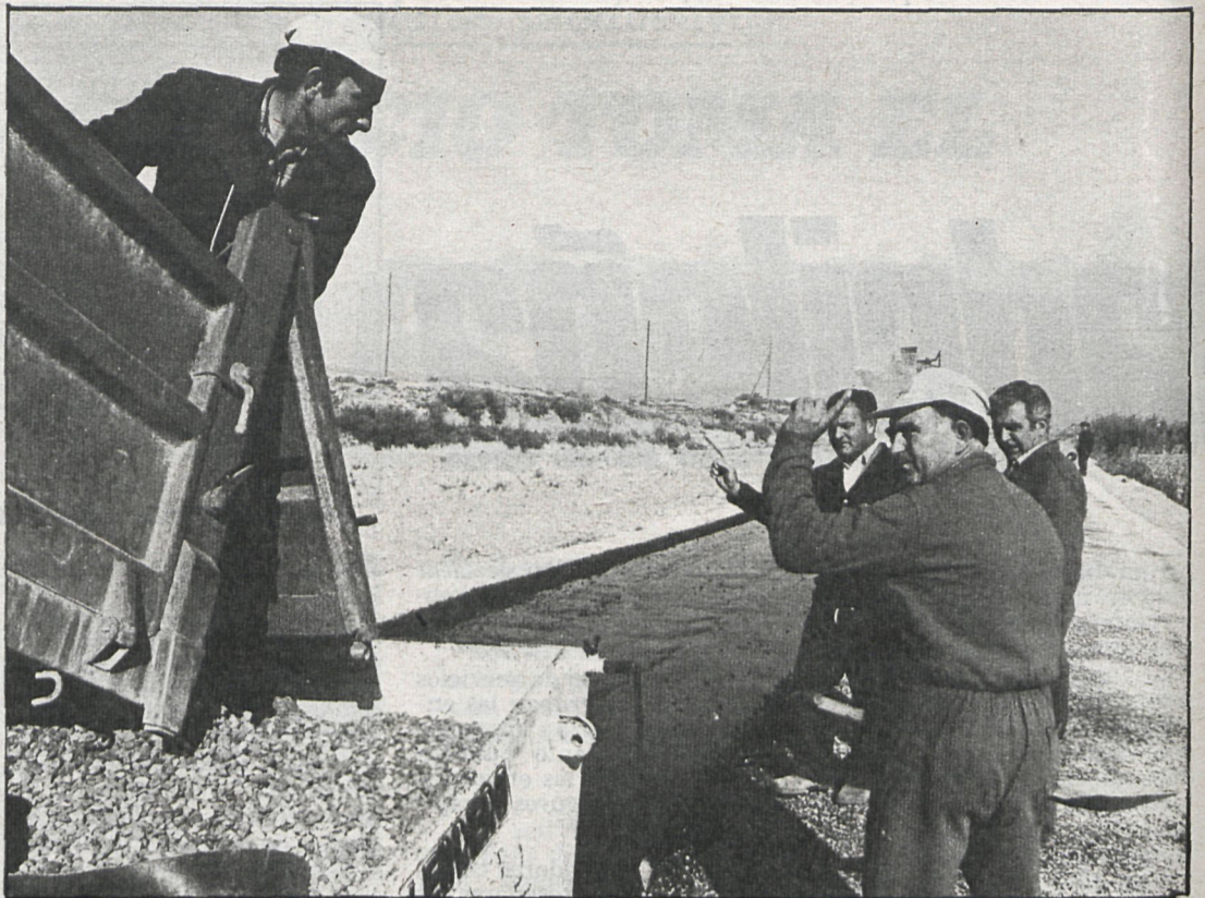
Para los empresarios, la jornada de cuarenta horas supone un aumento de costes, pero no un aumento de productividad

La no existencia de ese acuerdo marco para la globalidad de los trabajadores traería, inevitablemente, consigo una conflictividad innecesaria y altamente peligrosa en estos momentos cruciales.