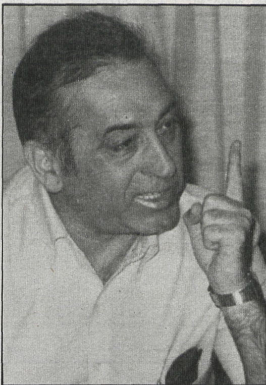
Nicolás Redondo, secretario general de UGT