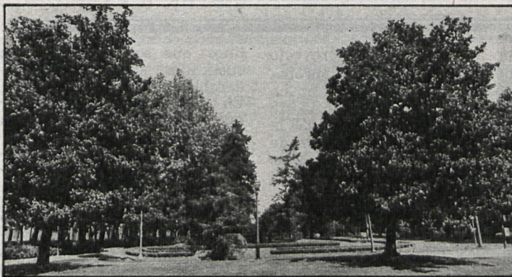
Mientras se solucionan los conflictos urbanísticos existentes, el Ayuntamiento lleva a cabo el ajardinamiento del municipio, con la creación de numerosos parques

como aval corresponden a la cantidad que el Ayuntamiento piensa que deben invertirse en las obras de urbanización, puesto que de los 44 que se estipularon en un principio, 14 han sido ya cubiertos.