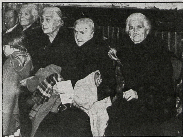
Los ancianos de Montejo de la Sierra tuvieron un día alegre con la fiesta que se celebró en su honor

En el acto del pasado día 26, además de la comida ofrecida por los jóvenes, se contó con la asistencia del grupo musical Escuela Española de Acordión, formado por quince jóvenes que han obtenido distintos trofeos nacionales e internacionales. El fin de fiesta fue amenizado por los mismos vecinos de Montejo, como viene siendo habitual en estas ocasiones.