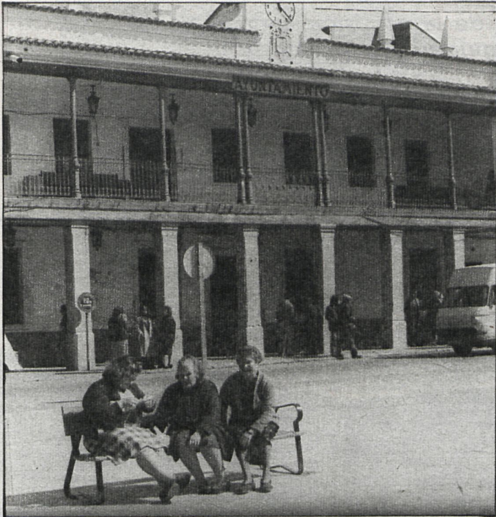
Constructora, vecinos y Ayuntamiento se dieron cita en la Casa Consistorial para encontrar una solución negociada