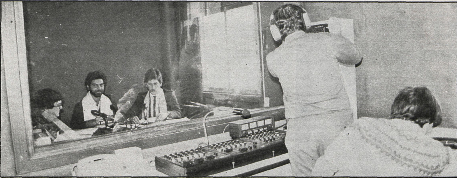
Sobre estas líneas, parte del equipo de Radioestudio, que desde el pasado día 20 está en antena

Situada en Alcobendas, comenzó su emisión el pasado día 20