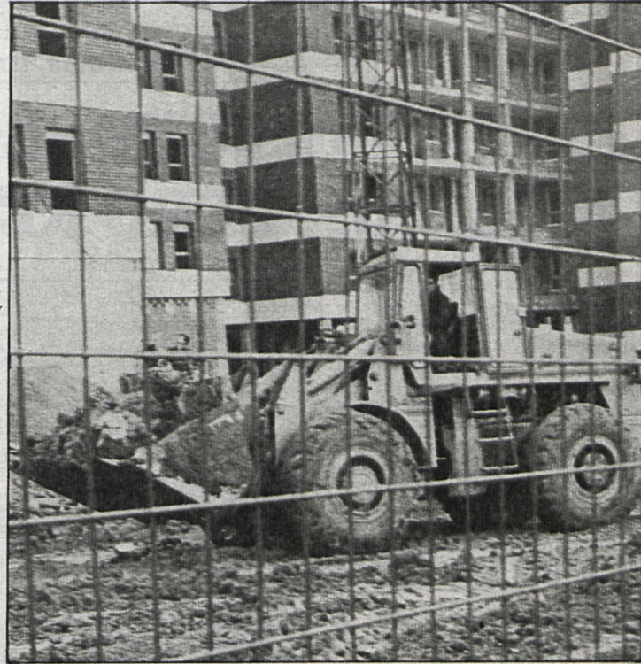
La Corporación quiere que las urbanizaciones queden totalmente terminadas