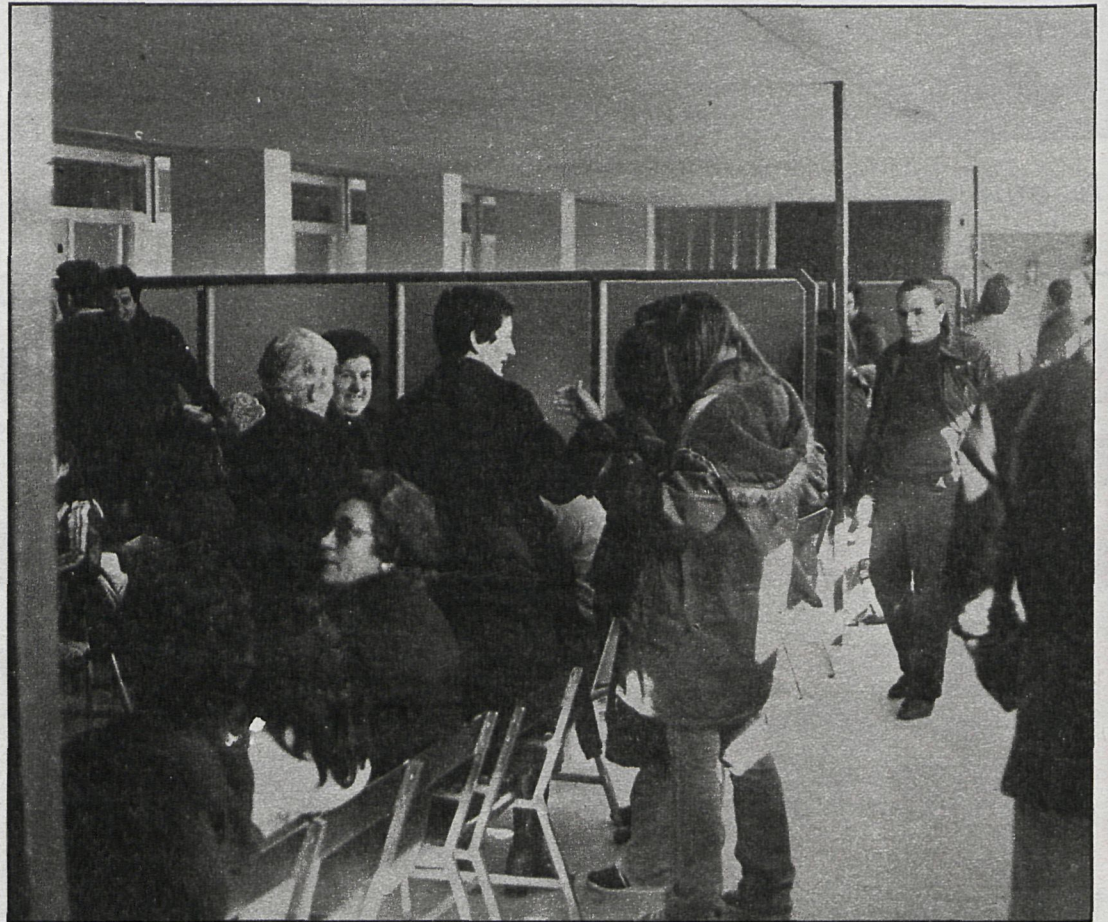
Las salas de espera de los consultorios de la Seguridad Social de Alcalá llenas de enfermos, que luego serán atendidos dos minutos como máximo

En el apartado de especialidades, el estudio recoge una serie de datos sobre, por ejemplo, toxicología. En esta especialidad se pasan ciento cuarenta y cinco horas semanales, de las cuales noventa y siete se hacen a través de la medicina privada, lo que representa un 66 por 100 del total. En la especialidad de estomatología la situación es más deficitaria, el 82 por 100 de los niños de nueve a catorce