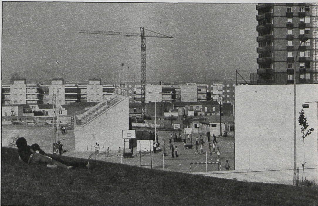
El presupuesto aprobado para el Patronato Deportivo Municipal se eleva a 111 millones de pesetas

Según la memoria presentada, la situación económica financiera del Ayuntamiento de Coslada ante el presente ejercicio puede considerarse favorable, ya que las previsiones tanto de ingresos como de gastos va a permitir hacer frente no sólo a los servicios municipales ya existentes, sino también a los de nueva creación, origina-