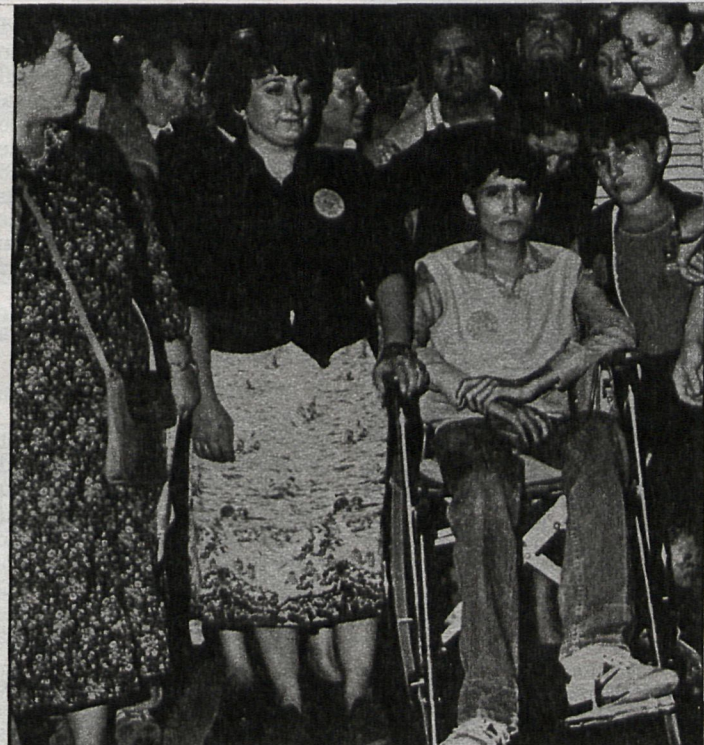
Los afectados por la colza han protagonizado numerosas manifestaciones y encierros

En un comunicado hecho público requieren información sobre las secuelas y la evolución de la enfermedad