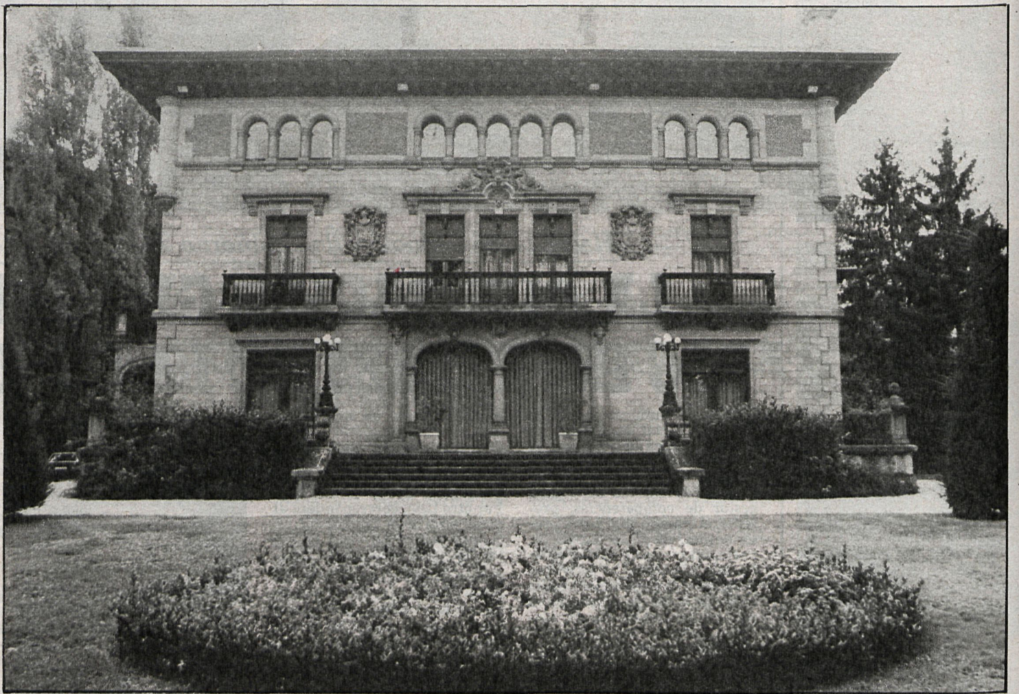
Palacio de Ajuria-Enea, sede de la autonomía en el País Vasco

Cuando se han cumplido tres años desde que el Gobierno vasco surgió de las elecciones de marzo de 1980 comenzara su andadura, se puede decir que su tercer ejercicio ha sido