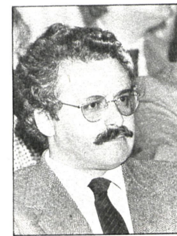
Joaquín Leguina, candidato número 1 del PSOE a la autonomía madrileña

En el tema presupuestos seguirán en vigor los de la Diputación de Madrid, aprobados para el ejercicio de 1983, de acuerdo con lo establecido en el artículo 9 y disposición transitoria quinta, y se realizarán de acuerdo con sus respectivas bases de ejecución. Seguirán