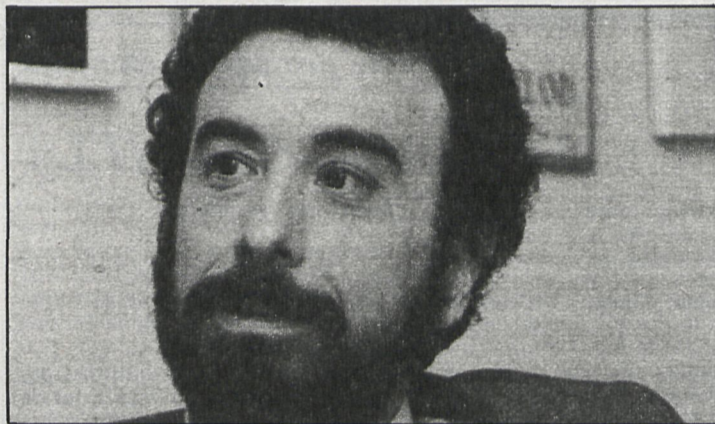
José Luis Garci

La Academia reúne en su seno a gran parte de los que se dedican a hacer cine dentro de la industria norteamericana. Todas las profesiones están representadas, y algunos extran-