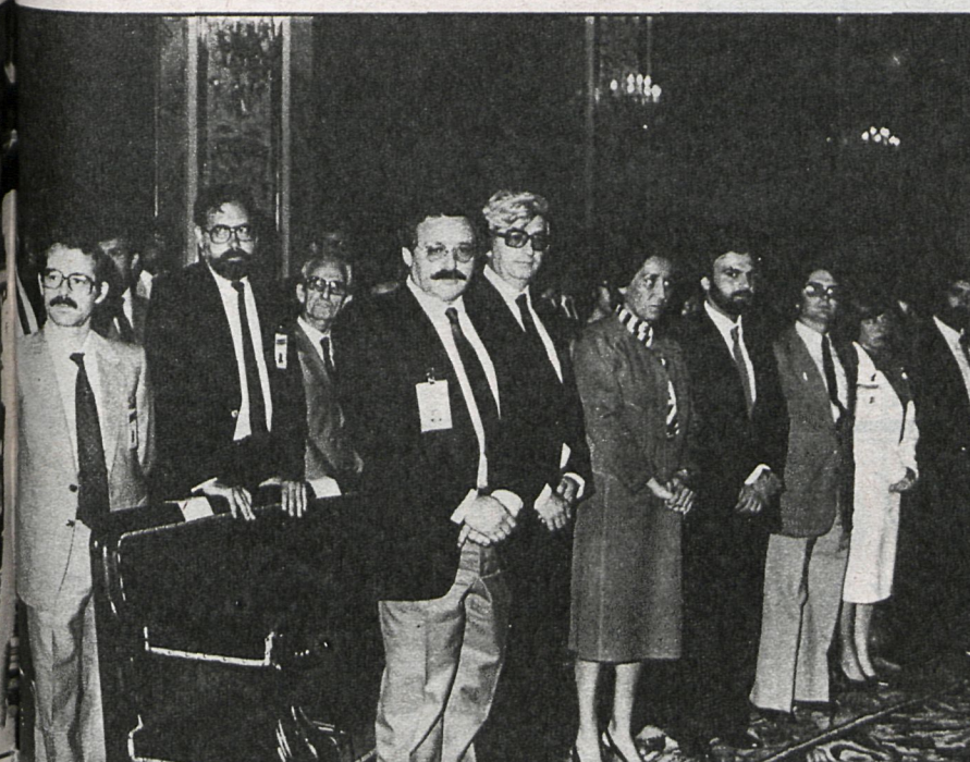
3 y 4 Todos los diputados, puestos en pie, juraron o prometieron desempeñar sus cargos con lealtad al Rey, a la Constitución y al Estatuto de Autonomía