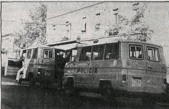
La dotación policial destinada en la comisaría de Alcorcón podrá realizar más eficazmente su labor gracias a las nuevas instalaciones

■ La festividad de San Juan se están celebrando en distintos barrios de las localidades madrileñas, incluida la capital. En el barrio de San Juan de la Cierva, de Getafe, está teniendo lugar, del 24 al 26 de junio, las fiestas de su Patrón. Comienzan las jornadas festivas con una charanga que recorre las distintas calles del barrio despertando a todos los vecinos y animándoles a sumarse a la comitiva festiva.