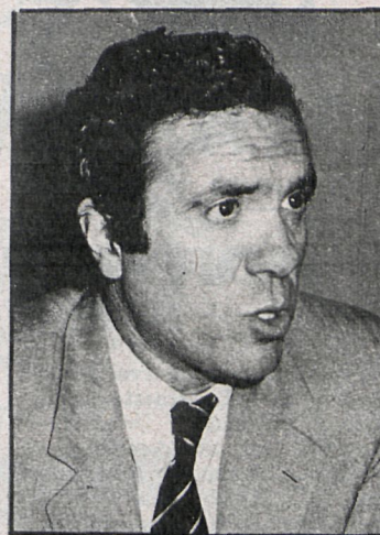
José Barrionuevo, ministro del Interior

Por su parte, el comisario de Policía Celestino Villar manifestó que la anomalía de las anteriores dependencias habían sido salvadas por la normalidad del servicio efectuado por los policías. Afirmó también que sus objetivos deben ser proteger el libre ejercicio de los derechos y libertades