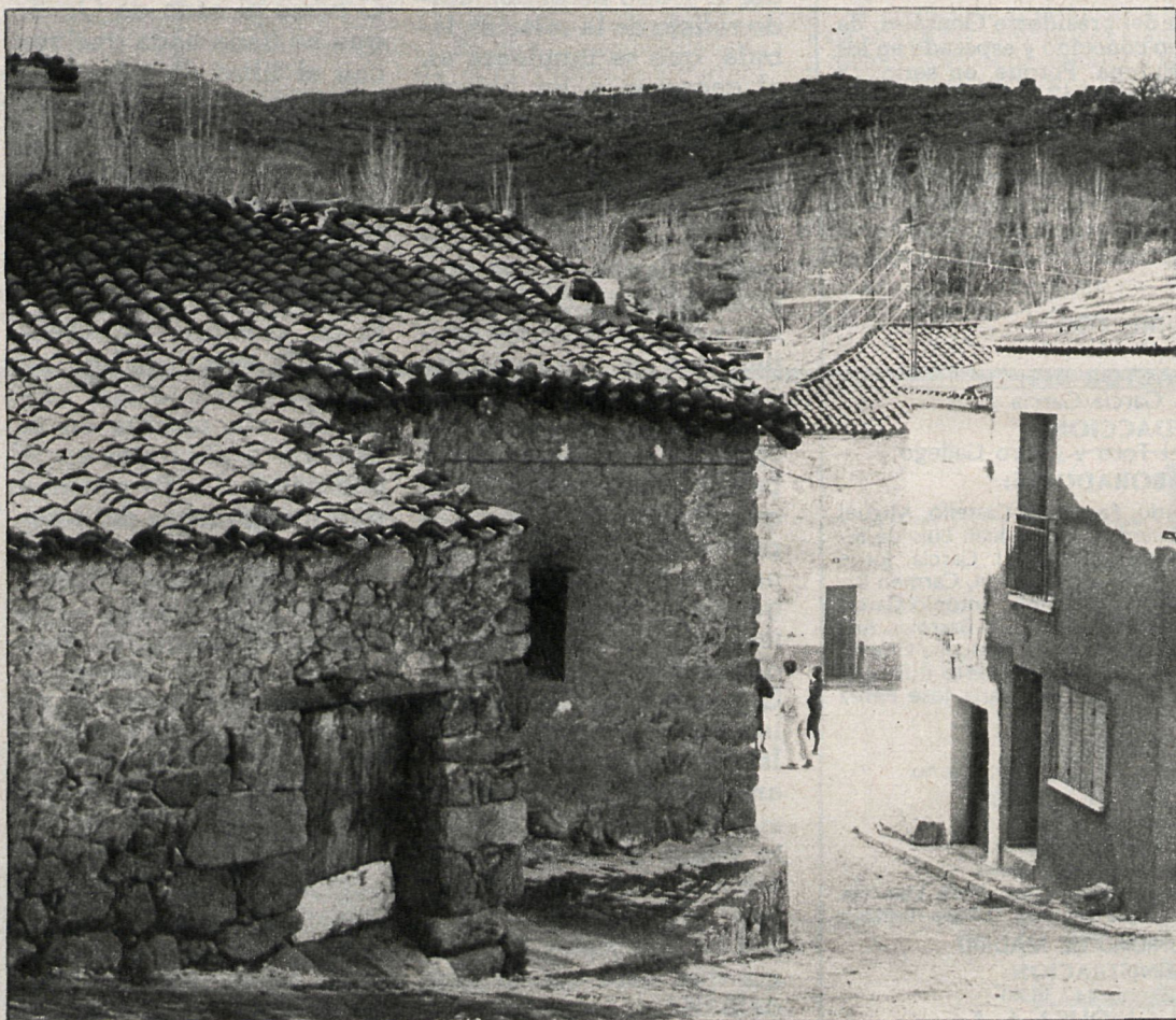
Al no poderse construir la presa que estaba prevista, las Rozas de Puerto Real volverá a tener problemas de agua, como ya ocurrió el pasado año

Los que sí van a conocer restricciones son algunos pueblos de la región de Madrid que vienen arrastrando durante bastante tiempo problemas de abastecimiento de agua y que