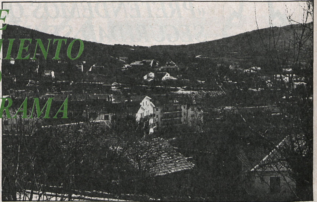
Los municipios de la sierra de Guadarrama se verán beneficiados por las medidas de saneamiento

«Las obras darán comienzo antes de un año»