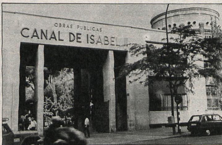
El Canal de Isabel II quiere racionalizar el consumo del agua

Las restricciones, una auténtica amenaza para algunos pueblos madrileños durante este verano