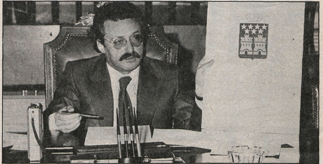
Joaquín Leguina enseña a los representantes de los medios de comunicación el proyecto de escudo de la región durante la rueda de prensa mantenida en torno a este tema

«Se está atacando —dijo Leguina— no al contenido, sino a la propia existencia de los signos, y eso es negar el Estatuto y la propia autonomía madrileña.» Hizo hincapié en que tanto bandera y escudo como himno son sólo un proyecto que tendrán que refrendar la Cámara para que sea ley. Aunque a su grupo le parece bien los signos, aunque susceptibles de retoques, está dispuesto a discutirlos y dijo estar convencido de que una vez que se conozcan bien desaparecerán las reticen-