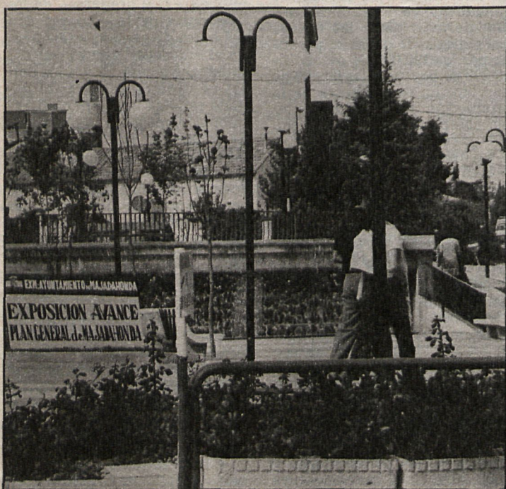
La aprobación del plan general de Majadahonda ha estado presidida por una exposición en el municipio, donde los vecinos pudieron conocer más de cerca las propuestas que contemplaba el proyecto