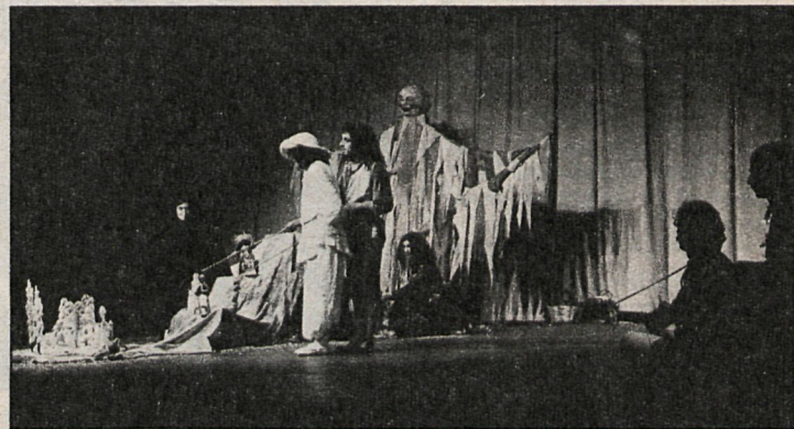
Diversas compañías han asistido a la I Muestra de Teatro en Torrejón de Ardoz