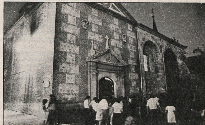
Fachada de la capilla del Oidor, donde fue bautizado Cervantes