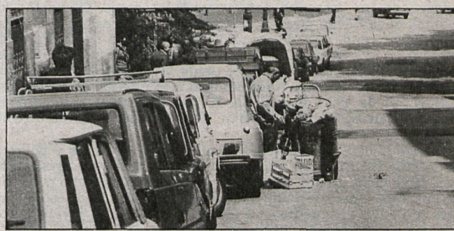
Campaña por una mayor limpieza en las calles de Navalcarnero

que cursan estos estudios es bastante considerable, ya que para el turno matutino se han inscrito 354 personas, y para el de la tarde, 168, a los que hay que añadir otros 500 que asisten también por la tarde a cursos que se imparten en cinco colegios públicos. Una vez que el nuevo centro cultural de Móstoles, ubicado a espaldas del Ayuntamiento, entre en