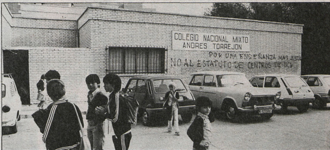
Durante los últimos años, en Móstoles se ha incrementado ostensiblemente la dotación de infraestructura escolar

Por otro lado se han construido 16 nuevas unidades en el colegio Federico García Lorca, así como un pabellón de servicios. De esta manera desaparecen los barracones que anteriormente albergaban a los estudiantes. También ha sido objeto de ampliación el Rosalía de Castro en ocho unidades más, con lo que a partir de ahora dispone de 24 aulas. Estos nuevos centros han entrado en funcionamiento durante los primeros días de octubre, quedando relegada su apertura al 2 de noviembre el Fernando de los Ríos, y según la Delegación de Enseñanza, los alumnos a él asignados han iniciado el curso repartidos provisionalmente en colegios adyacentes hasta que se produzca la definitiva apertura.