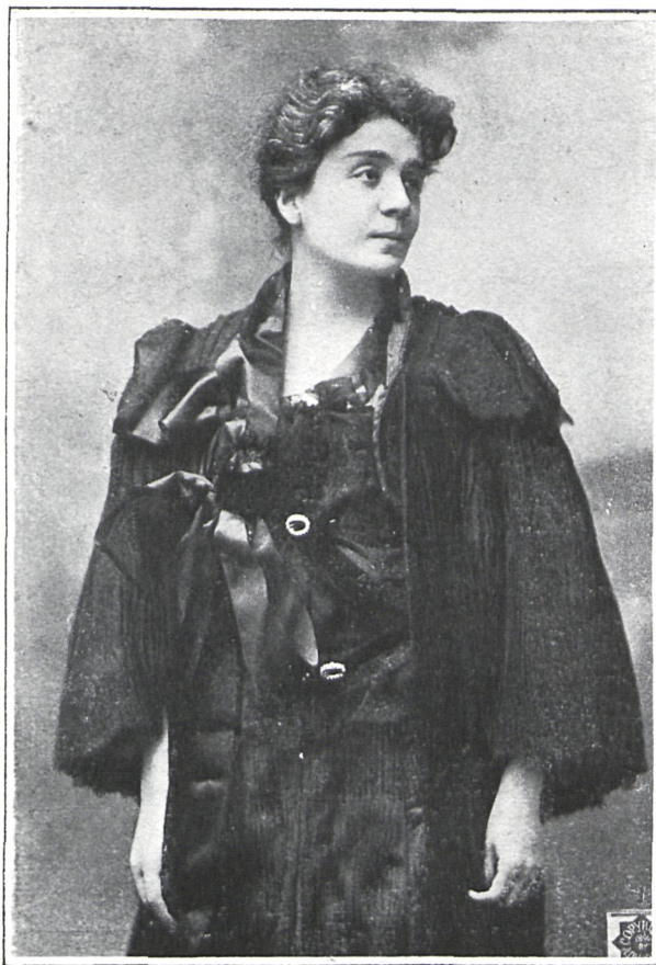
SIG. ELEONORA DUSE (ITALIA)