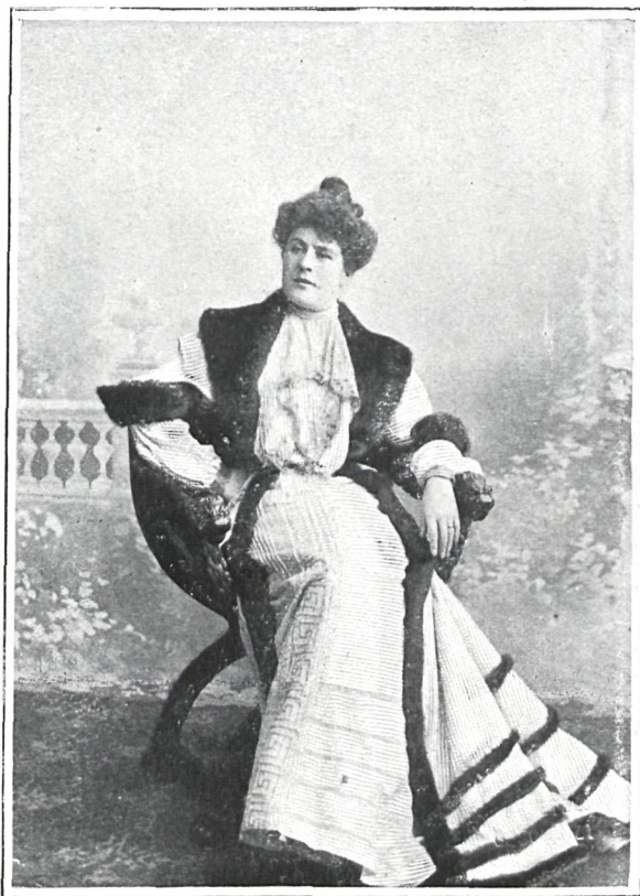
HÉLÈNE ODILCN (AUSTRIA)

Forma parte de la compañía que actúa en el Teatro Real de Budapest, y está reputada como la primera actriz húngara. Domina con igual facilidad todos los géneros teatrales, y goza de tantas simpatías que el solo anuncio de su presentación en la escena llena el teatro.