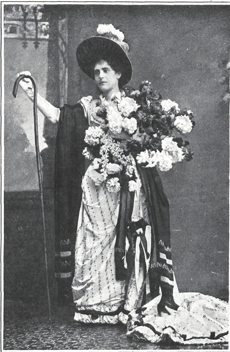
AMELIA VIEIRA (PORTUGAL)

Es la actriz favorita del público portugués, que la ha alentado con sus aplausos desde el comienzo de su carrera artística. Interpreta por igual todos los géneros dramáticos, pero prefiere siempre representar obras del repertorio ligero. Actualmente es esperada en París con gran curiosidad, pues se ha anunciado el viaje á la capital francesa de esta afamada actriz con objeto de dar varias representaciones teatrales.