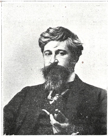
SANTIAGO RUSIÑOL Autor de « La alegría que pasa »

La acción de La alegría que pasa colócala el autor en un pueblo sin nombre; cualquiera, lo mismo dá uno que otro. La disposi-