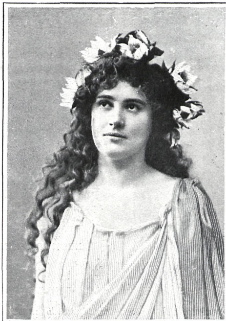
FRANLEIN SORMA (ALEMANIA)

Gioconda es la última obra teatral escrita por D'Annunzio, ya conocida por nuestro público por haberla puesto en escena la Duse en el teatro de Apolo el año anterior.