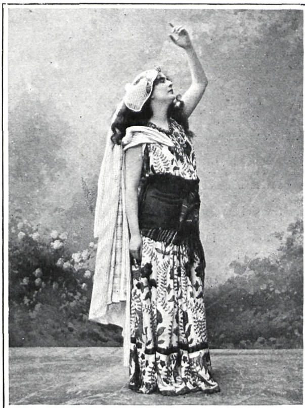
MAD. RAUNAY (BÉLGICA)

Comenzó la Sorma su carrera artística siendo aún muy niña, y poco tiempo después apareció en el teatro Deutsches haciendo la ingenua en Ingendliche , y obteniendo tal triunfo que desde aquel momento se apoderó de las simpatías del público berlinés, el cual conserva todavía el recuerdo de la impresión producida por la Sorma. En la actualidad el repertorio de la famosa actriz es muy extenso y cultiva todos los géneros. Su obra favorita es La