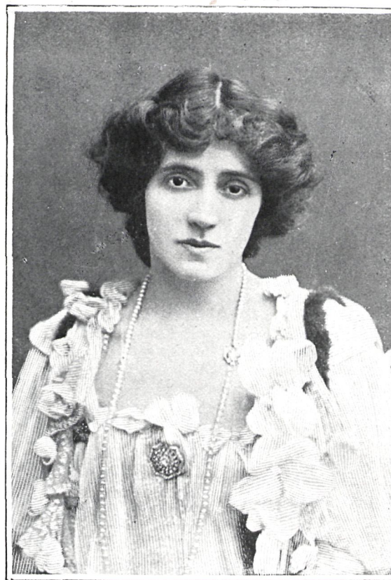
MRS. PATRICK CAMPBELL (INGLATERRA)