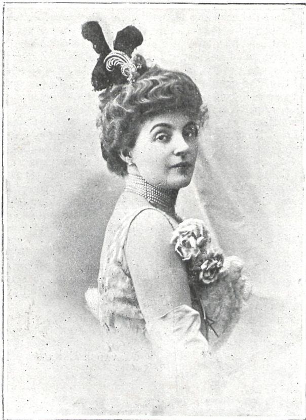
MAD. RÉJANE (FRANCIA)

Así como á Sarah Bernhardt puede llamársela la primer actriz trágica de nuestra época, la Réjane merece con justicia el dictado de Reina de la Comedia ; debiendo