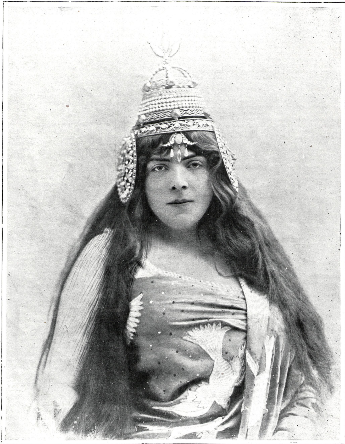
SENORA HEGLON, EN LA ÓPERA «ASTARTEA»