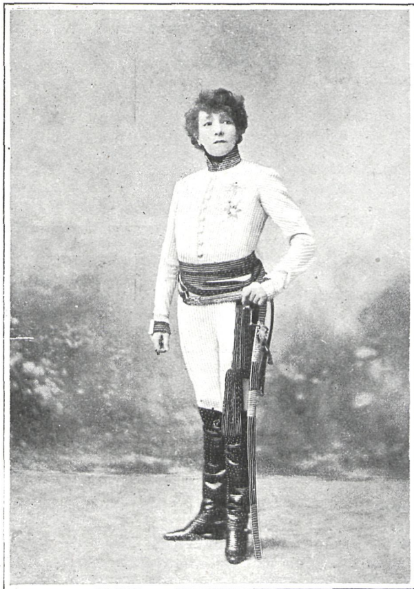
MAD. SARAH BERNHARDT (FRANCIA)