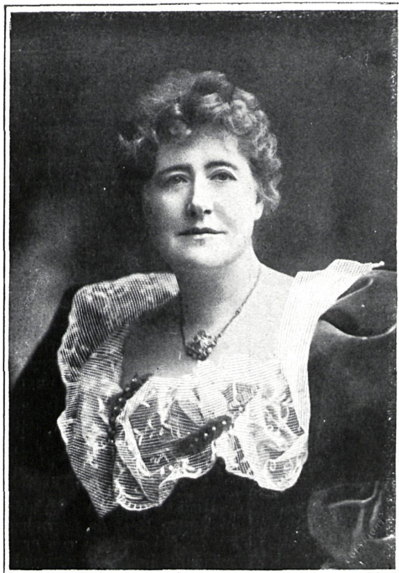
MRS. ELLEN TERRY (INGLATERRA)

Esta célebre artista inglesa, que desempeña admirablemente los caracteres de la alta comedia, es desde hace más de veinticinco años el ídolo de su público. Descendiente de una conocida familia de abolengo teatral, sus dos hermanas fueron eminentes artistas algunos años hace y su hermano y un hijo suyo recogen ahora entusiastas aplausos de los londinenses. Educada en el teatro desde su infancia y respirando la atmósfera de bastidores, no es extraño que Mrs. Ellen Terry sea no solo excelente comedianta, sino la mejor de su clase en Inglaterra; su gracia, su vivacidad, su peculiar manera de expresar el humorismo y sobre todo su