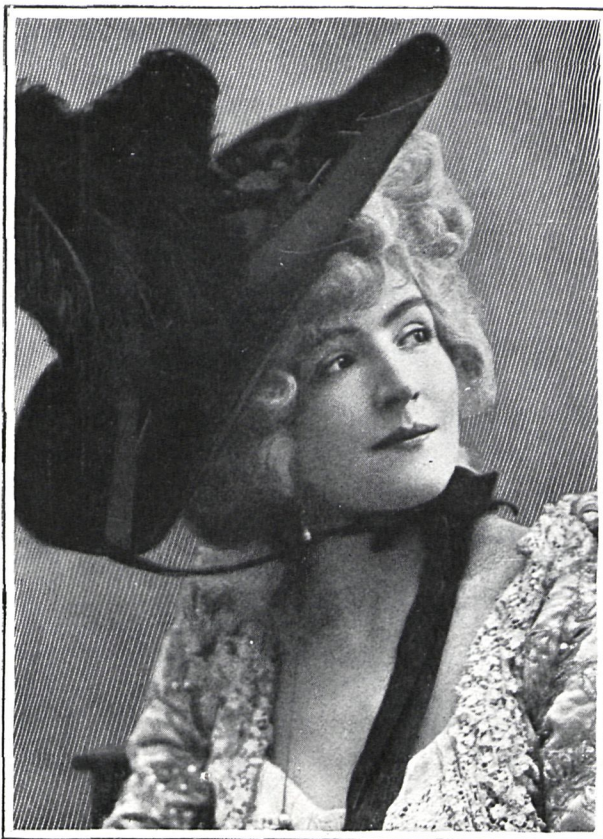
MRS. BROWN POTTER (INGLATERRA)

No quiere esto decir que sea una gran actriz dramática ni que interprete á las mil maravillas las comedias cuya ejecución se le encarga. Es que Mrs. Potter sabe comunicar tal aire de elegancia y distinción al arte á cuya devoción se ha consagrado, que difícilmente puede no ya superarla, sino igualarla ninguna de las artistas de más fama de Inglaterra. Amorosa en el decir, nada rutinaria en sus acciones, á las que sabe imprimir carácter propio, y elegante y sencilla al mismo tiempo que hermosa mujer, su teatro es de los más favorecidos, y basta que su nombre aparezca en los placards para que el teatro se llene de admiradores de la artista que la otorgan el galardón que más puede enorgullecer á quien, como mistres Potter, no es actriz de