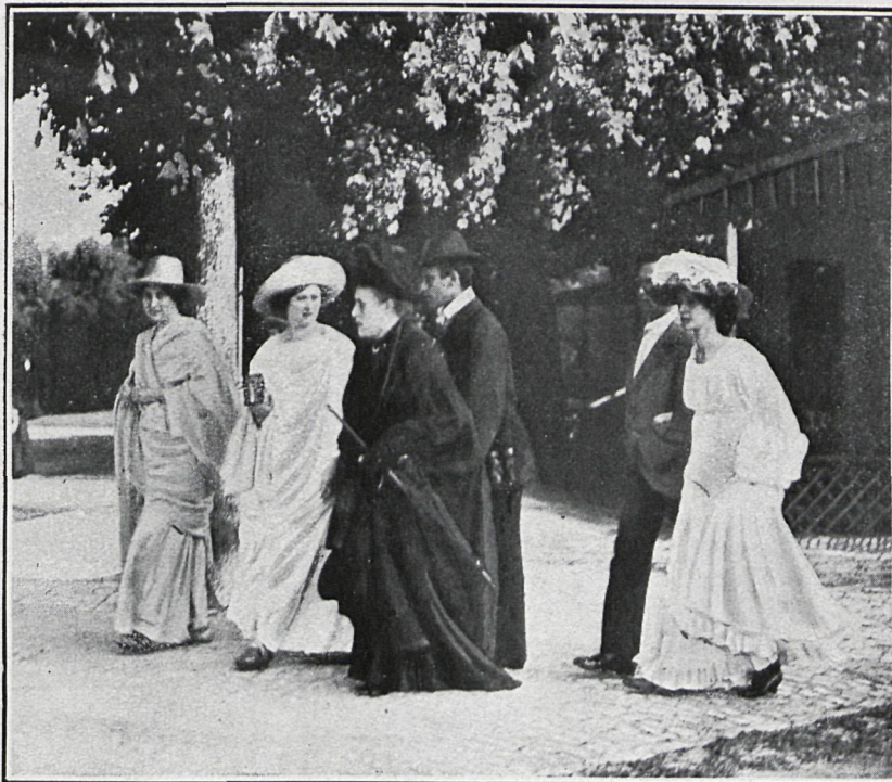
ARTISTAS DE BAIREUTH DIRIGIÉNDOSE AL TEATRO

La lectura de El Ultimo Tribuno , inspiróle su ópera Rienzi y acariciando la idea de estrenarla