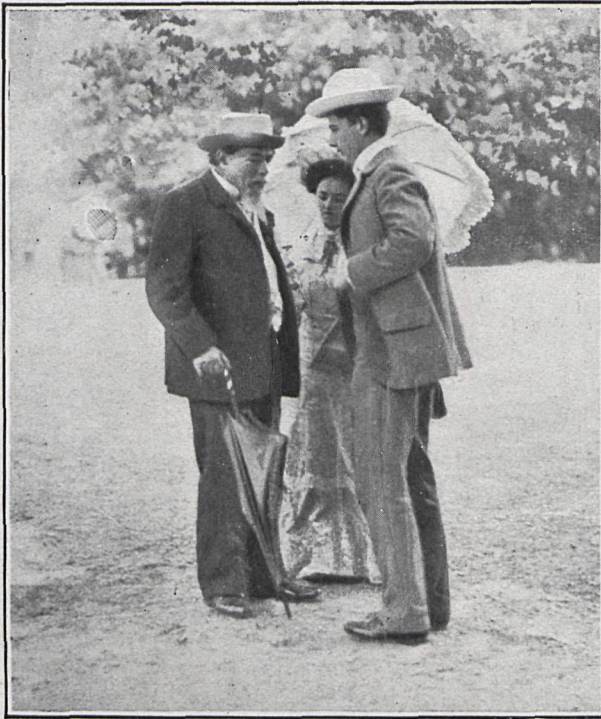
EL ADMINISTRADOR, BARÓN DE GRASS, CON DOS ARTISTAS