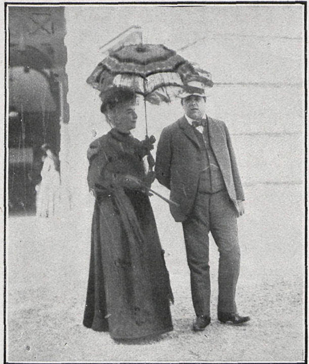
LA VIUDA DE WAGNER Y EL BAJO KINPFER

musical. Todos los que creen en Wagner se imponen la obligación de ir, por lo menos una vez en su vida, á Baireuth para escuchar la música del gran maestro en su templo.