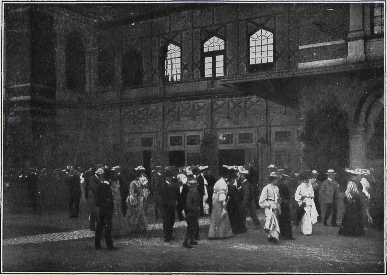
EL PÚBLICO SALIENDO DE UNA REPRESENTACIÓN EN EL TEATRO DE BAIREUTH