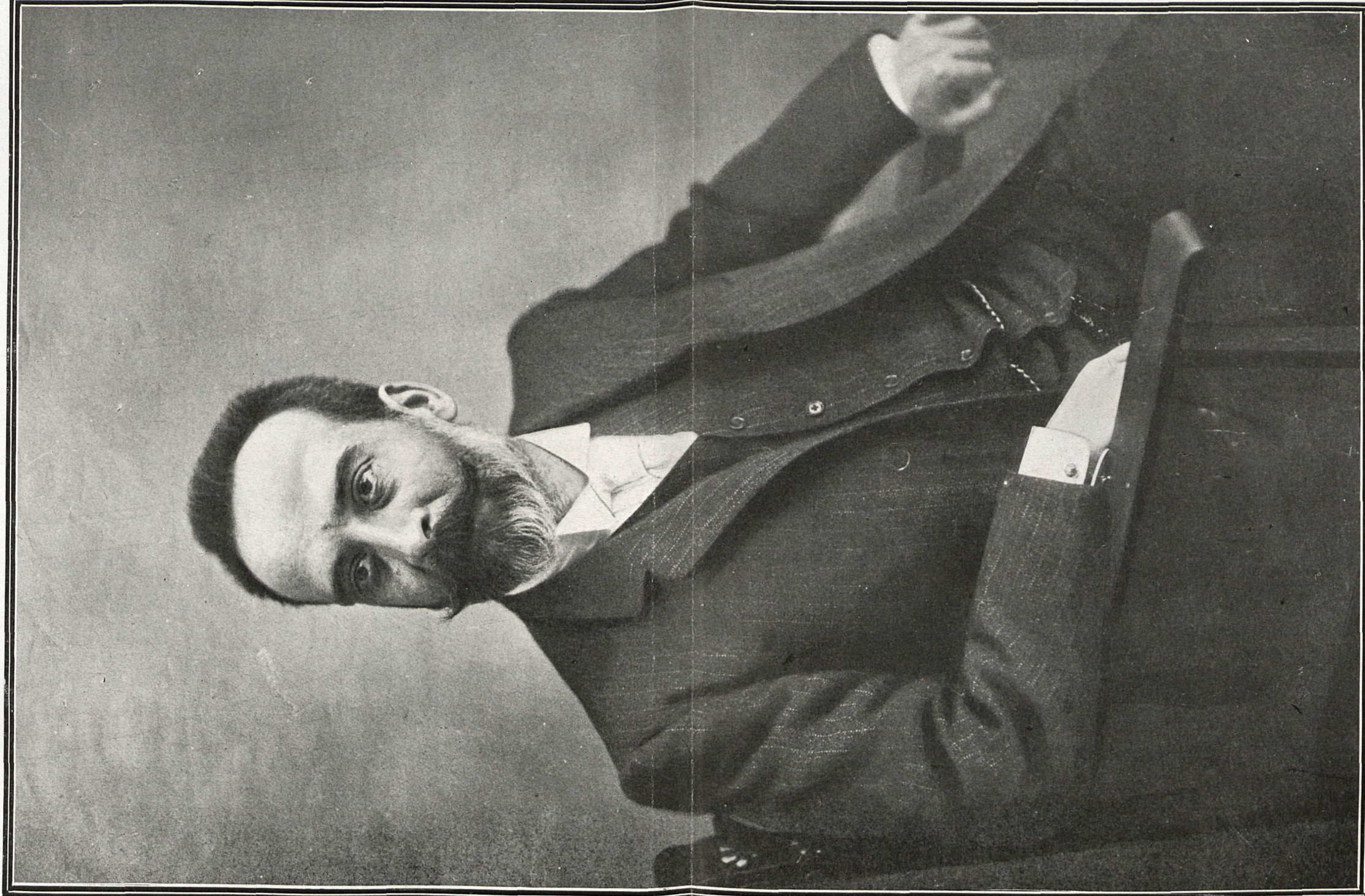
DON JERÓNIMO JIMÉNEZ, eminente compositor