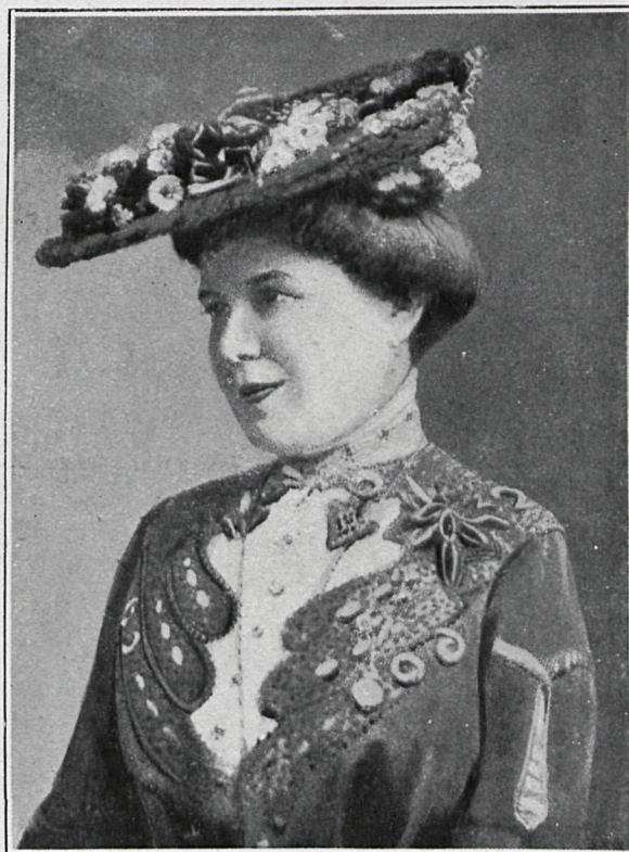
JOSEFINA DE ARTNER, PRIMERA TIPLE DRAMÁTICA