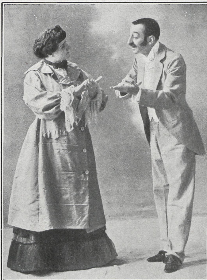
ESCENA DEL CUADRO PRIMERO DE «EL REY DEL VALOR»

Lo que hace falta ahora, es que esas obras estén pronto en disposición de ser representadas, pues el público se va aburriendo un poquito de ver siempre en escena aquellas que fueron desu beneplácito, pero que ya han caído en