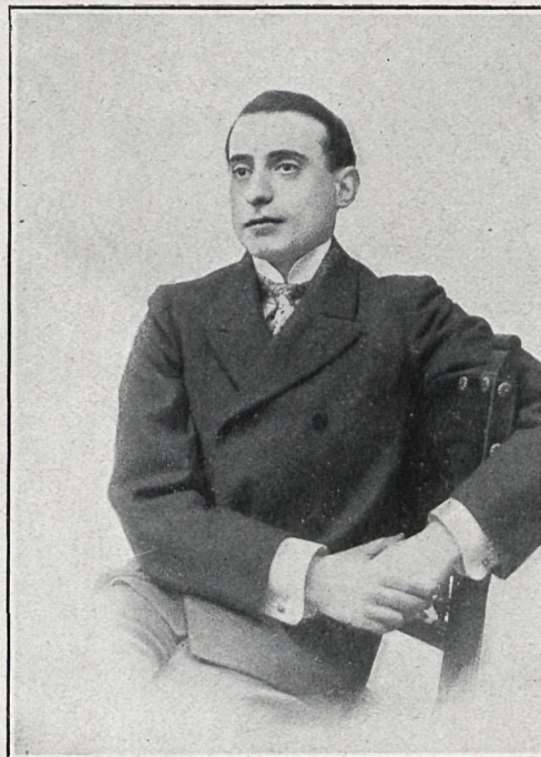
JOSÉ PONZANO, ACTOR CÓMICO

presentación escénica, repartiendo los papeles y ensayándolas con el mayor cuidado. Claro es que si no contara con elemento de tanta valía como Loreto Prado, sus esfuerzos no se verían coronados por un éxito tan bri-