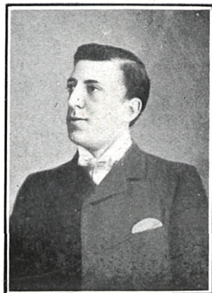
LUIS GONZÁLEZ, ACTOR CÓMICO

La labor de Enrique Chicote es digna de elogios, porque no se reduce á representar con el mayor entusiasmo los papeles que en las obras le corresponden, sino que prestando á este importante deber toda la atención y el cariño que exige, consagra sus iniciativas y sus esfuerzos á dirigir la campaña artística, escogiendo las obras, preparando su re-