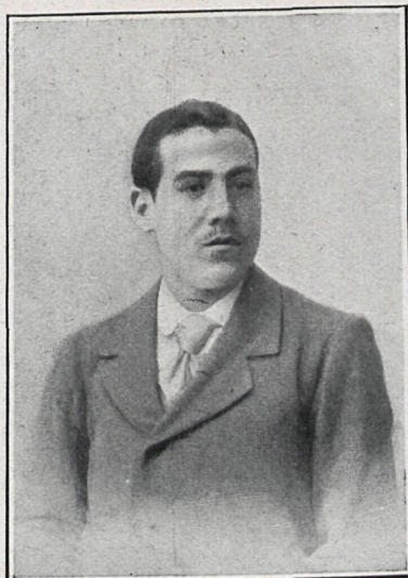
JULIO CASTRO, ACTOR CÓMICO

Sabemos también que la empresa del Moderno pondrá en escena un melodrama que se estrenó en París hace bastantes años y que fué uno de los mayores éxitos. De lo dicho se deduce que el cartel del Moderno será esta temporada tan variado como el público exige.