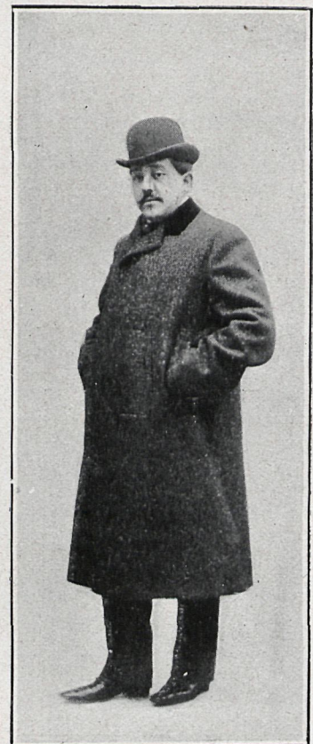
JAIME NART, ACTOR CÓMICO