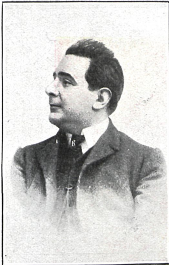
ENRIQUE CHICOTE, DIRECTOR

UNA de las compañías que más brillante campaña realizaron el último invierno en Madrid, fué la que dirige Enrique Chicote, y á la que pertenece Loreto Prado, la actriz verdaderamente incomparable, que con los mejores títulos ha conquistado el primer puesto en el género á que consagra sus facultades y su ingenio.