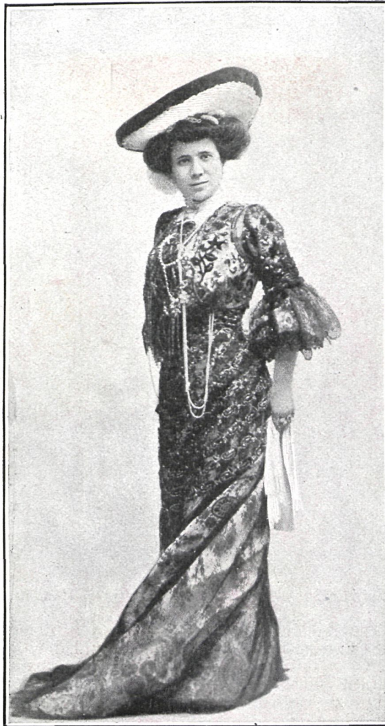
LORETO PRADO, PRIMERA ACTRIZ

Por virtud de los grandes atractivos que por sí solo ofrece en un cartel el nombre de Loreto Prado, y por virtud también de las excelencias que su trabajo ofrece, el teatro Moderno fué en la última temporada el que distinguió el público con su predilección constante, y el que realizó la