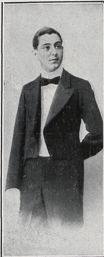
LORENZO VELÁZQUEZ, ACTOR CÓMICO

presentación escénica, repartiendo los papeles y ensayándolas con el mayor cuidado. Claro es que si no contara con elemento de tanta valía como Loreto Prado, sus esfuerzos no se verían coronados por un éxito tan bri-