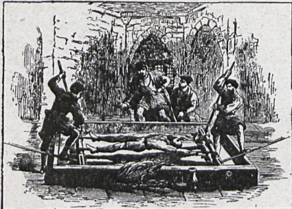
EL TORMENTO DE LA RUECA

Era éste un hombre de carácter y costumbres ejemplares, que había servido á la familia con la mayor fidelidad durante veintinueve años y que era considerado como un excelente esposo, un buen padre y un abnegado sirviente. Sin embargo, las pruebas