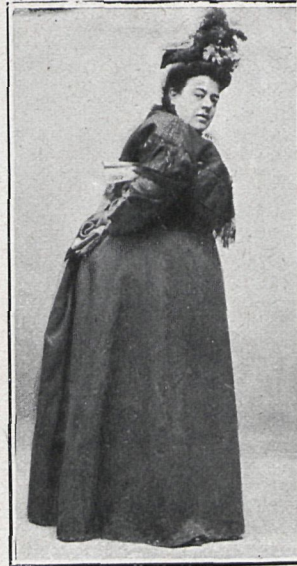
LA DE ORBANEJA, Sra. Train