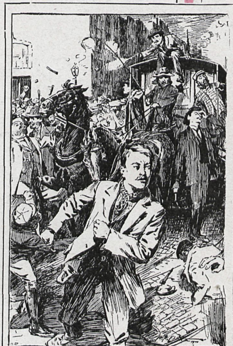
LOS AGENTES VENCIERON Á TIROS LA OPOSICIÓN DE LOS RUEQUISTAS

Los pedidos á NUEVO MUNDO, Santa Engracia, 57. Madrid