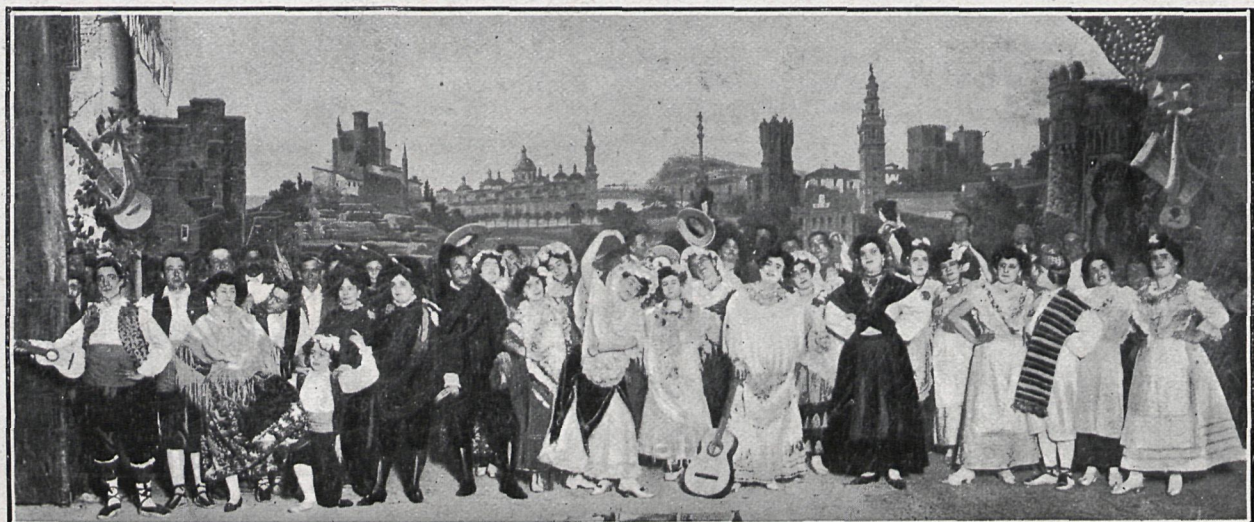
CUADRO TERCERO.—LA MÚSICA