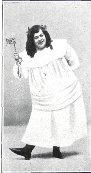
LA CARRACA, Srta. Train