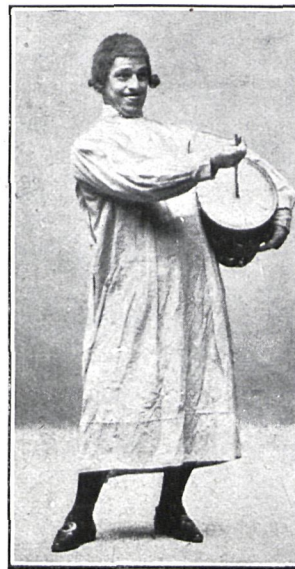
LA ZAMBOMBA, Sr. León