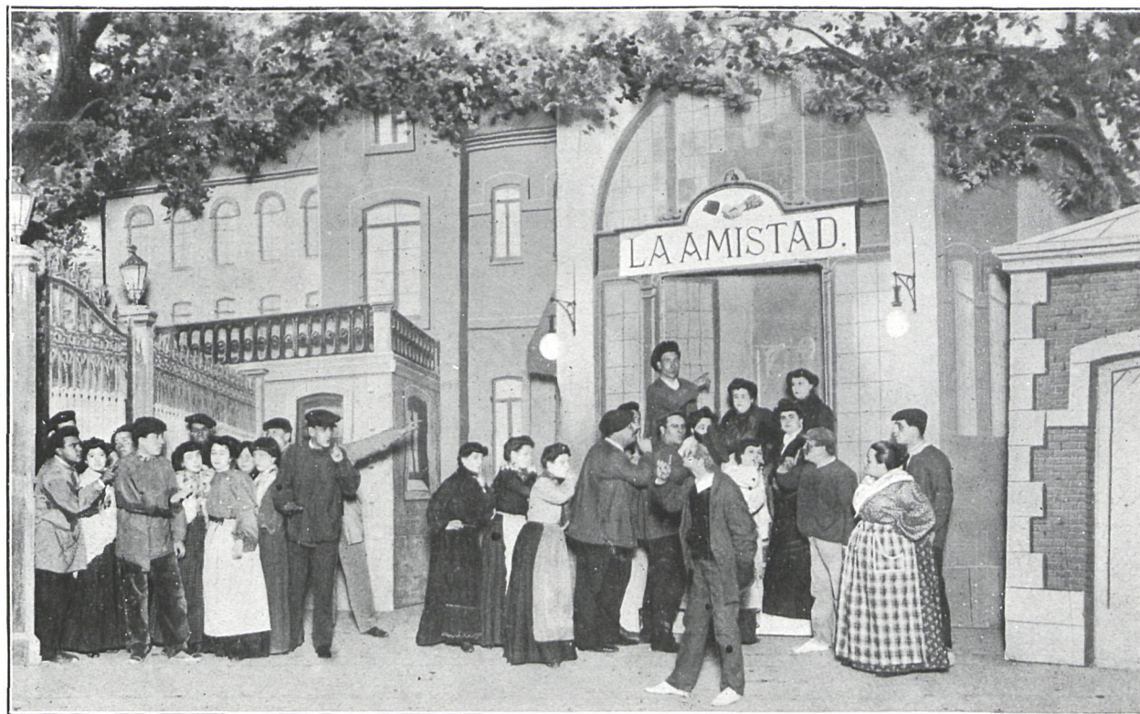
«EL DINERO Y EL TRABAJO».—CUADRO SEGUNDO.—EL RELEVO DE LOS OBREROS DE LA FÁBRICA