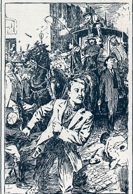
OS AGENTES VENCIERON Á TIRAR LA OPPOSICIÓN DE LOS RUEQUISTAS

Los pedidos á NUESTRO MUNDO, Santa Engracia, 57. Madrid