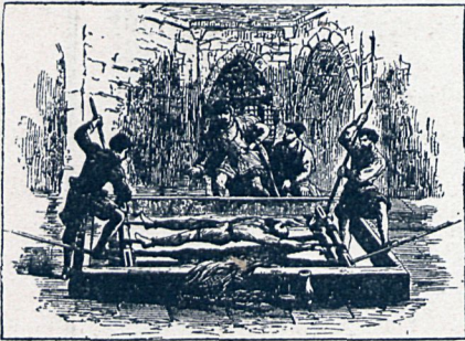
EL TORMENTO DE LA RUECA

Era éste un hombre de carácter y costumbres ejemplares, que había servido á la familia con la mayor fidelidad durante veintinueve años y que era considerado como un excelente esposo, un buen padre y un abogado vircente. Sin embargo, las pruebas