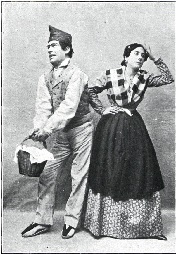
TOFOL Sr. Casinos