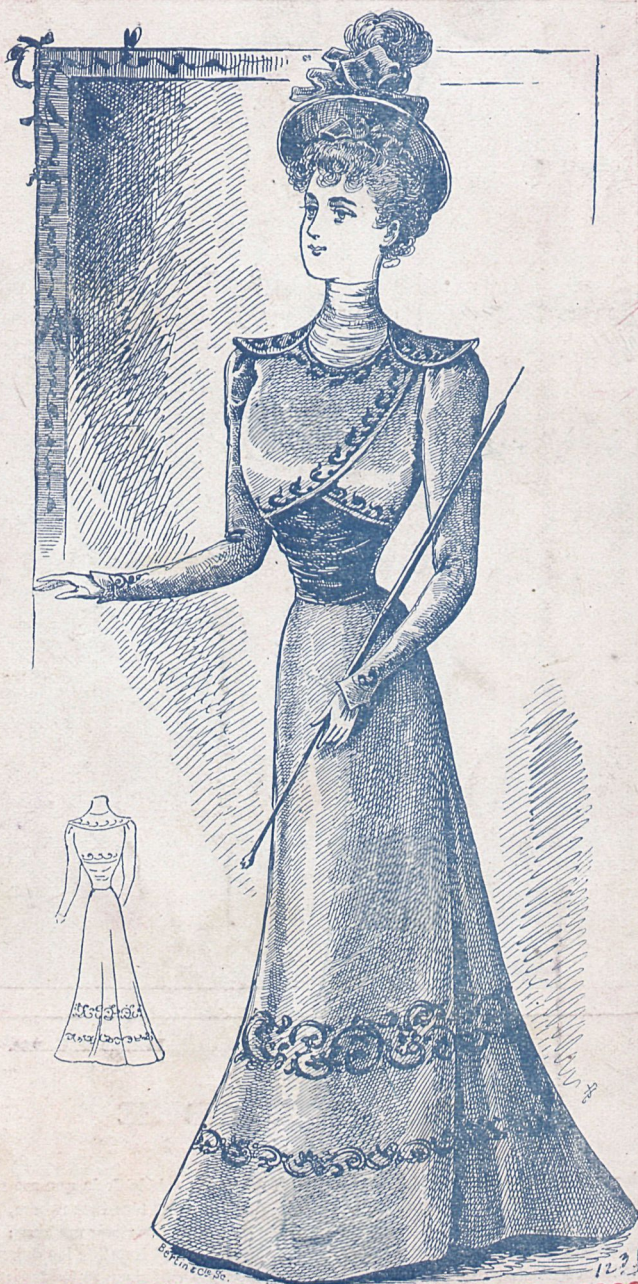
Toilette gran moda para señorita.