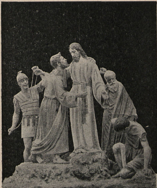
El Prendimiento. ZAMORA