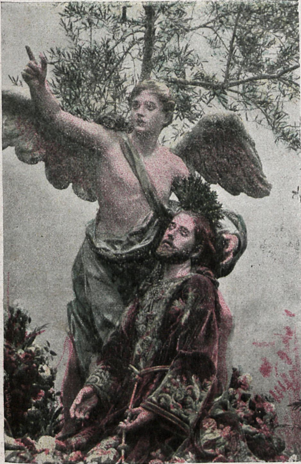
LA ORACIÓN EN EL HUERTO Célebre paso de Salcillo de la ciudad de Murcia