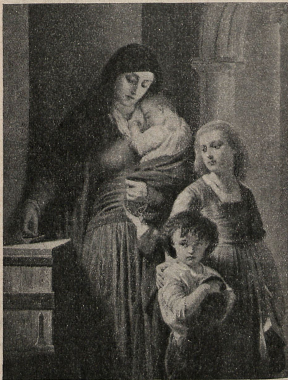
Cuadro de E. Debufo.