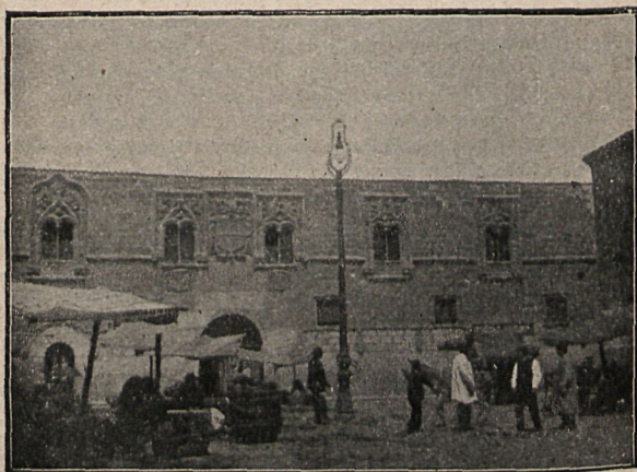
Palacio de los Momos.