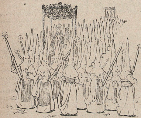
La procesión en Sevilla.

Es de admirar más la grandiosa labor de Salcillo, si se tiene en cuenta que floreció en la prime-