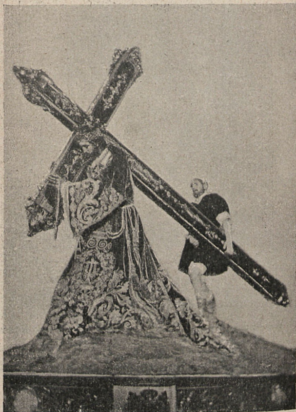
Jesús Nazareno que se venera en la Iglesia de la Merced.