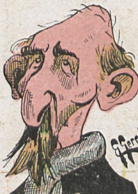
El Magisterio Español