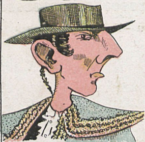
El Tio Jindama