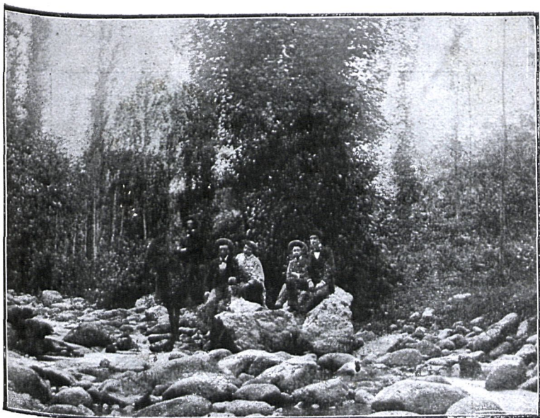
Inst. de J. Faure Gómez.