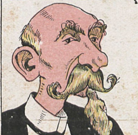
La Correspondencia Militar