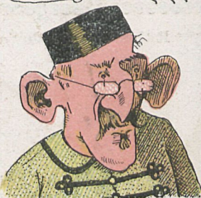
La Semana Catolica