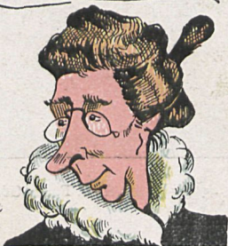
Moda y Arte