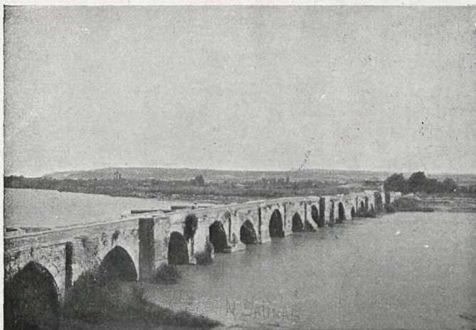
ext. de Salinas.