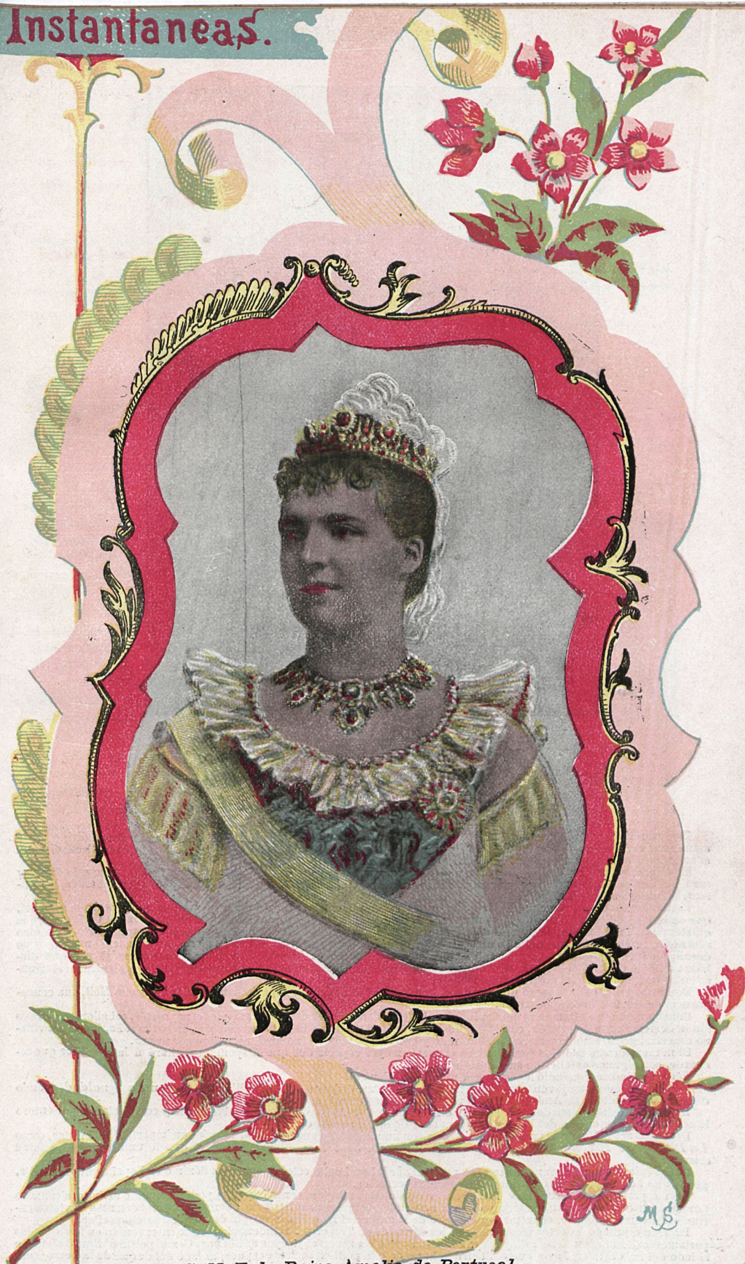
S. M. F. la Reina Amelia de Portugal