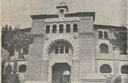
Nueva plaza de Toros.—Arenas de Barcelona.