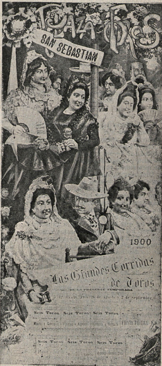
Cartel ejecutado en los talleres litográficos de D. J. Ortega, de Valencia.