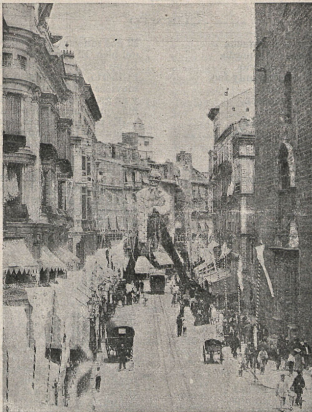
VALENCIA—Calle de San Vicente. Coloso «Tío Nelo», colocado durante las fiestas.