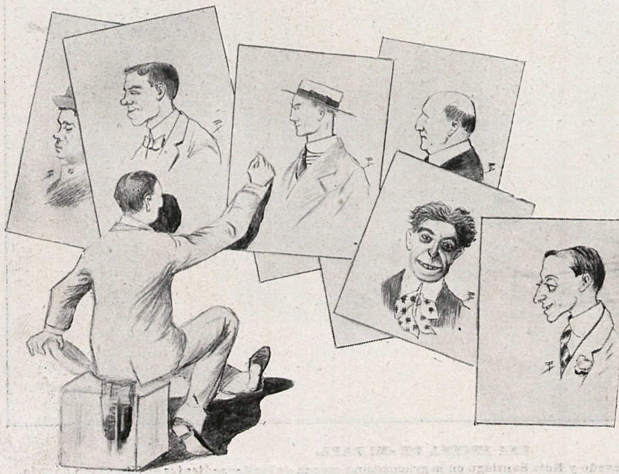
Caricaturas hechas por Puga.

Y de este modo, al descubrir semejante secreto, quedas como un ser superior ante los ojos del referido vecino.