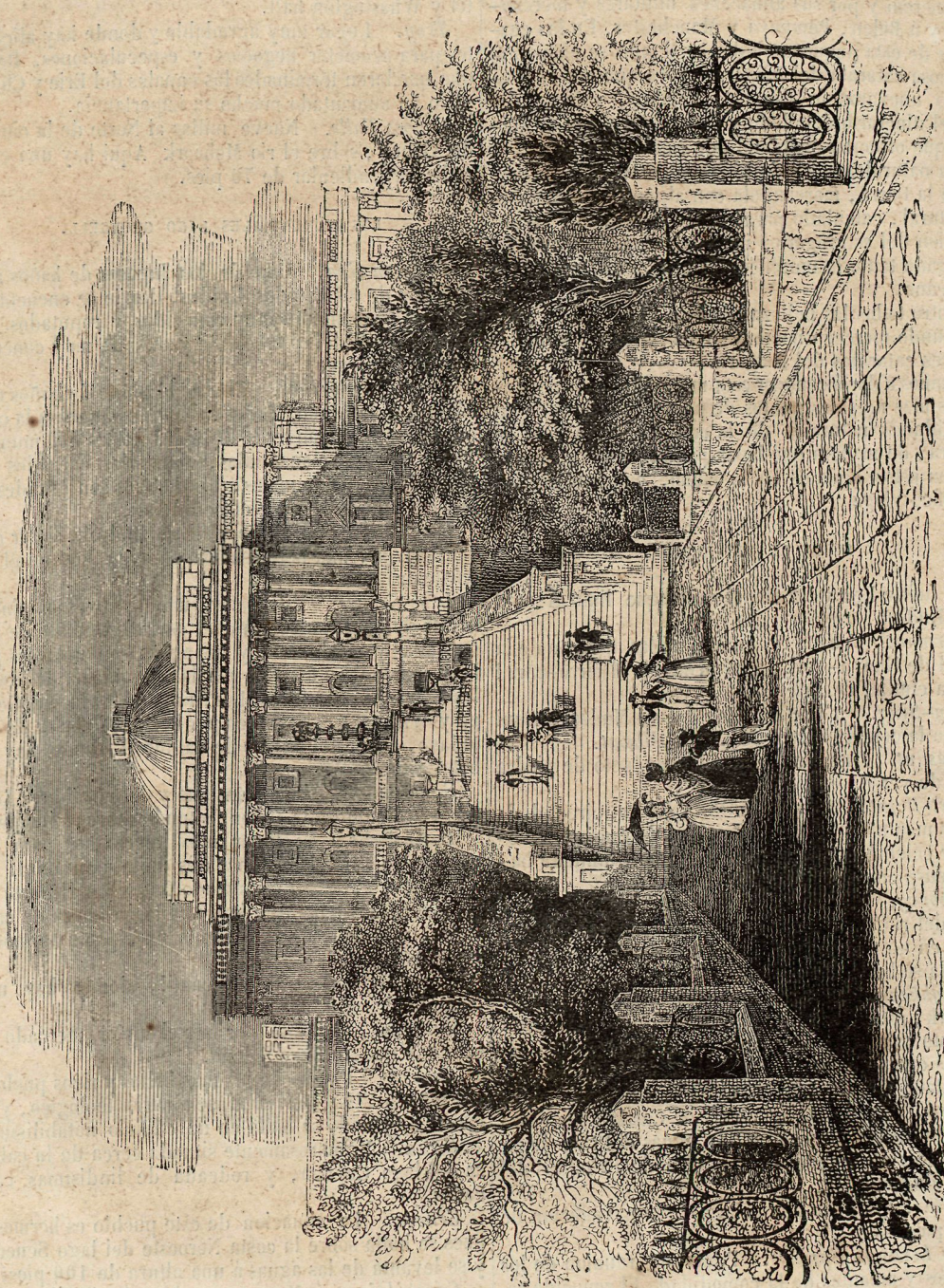
Vista del capitolio de Washington.

tas, por ferro-carril, y se halla situada al principio de la navegacion por vapor del Niágara. Las alturas de Questorn sobre el Canadá se han hecho célebres por la sangrienta batalla de que fueron teatro en la última guerra de este pais. En este punto sucumbió el